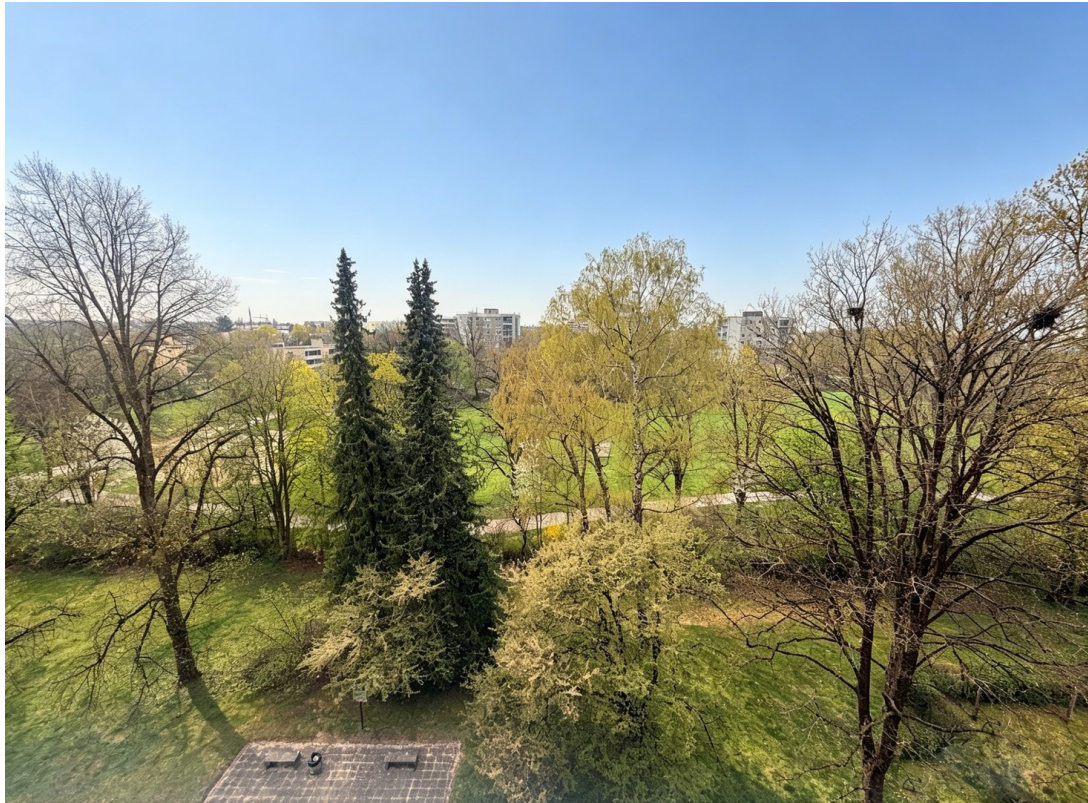
Blick von Loggia