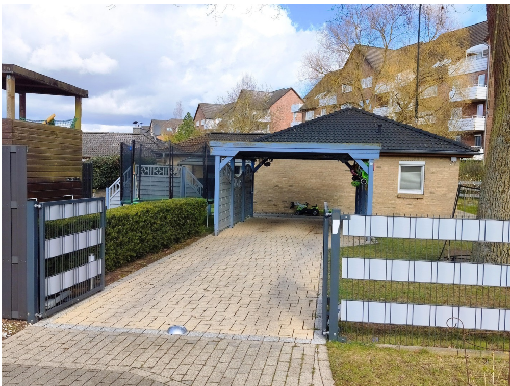
Zufahrt 1 mit Carport