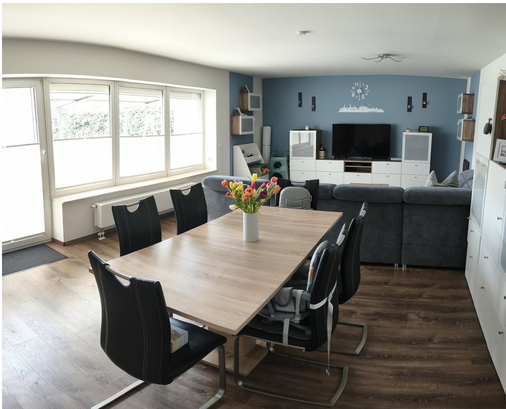
Wohnzimmer ca. 38m 2