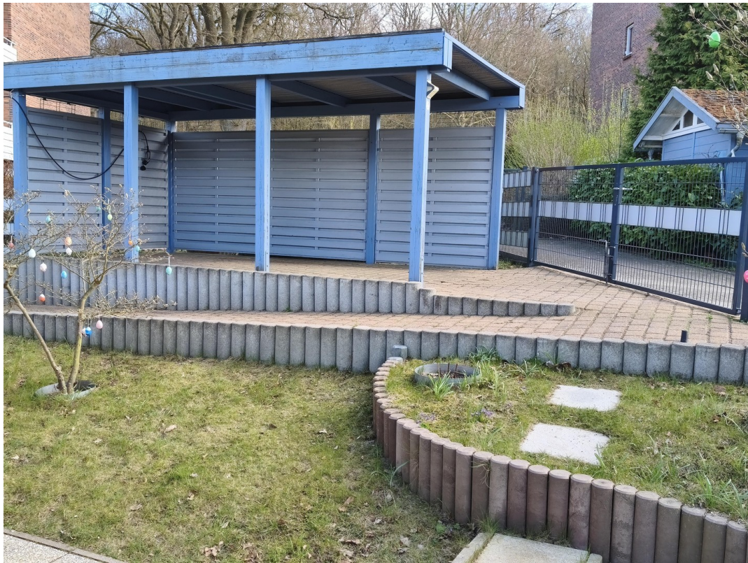
Zufahrt 2 mit Carport