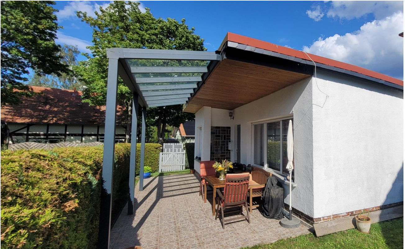
überdachte Terrasse vorne