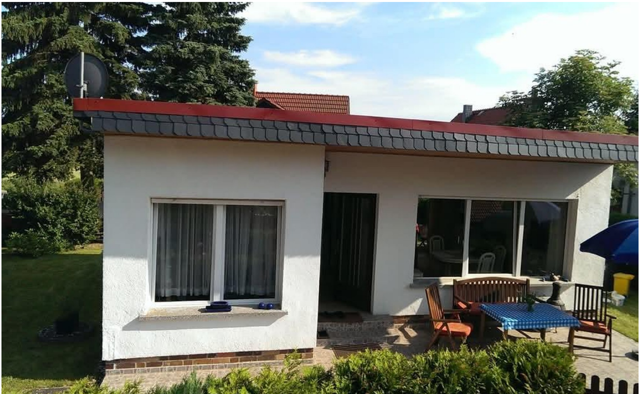
vor der Überdachung