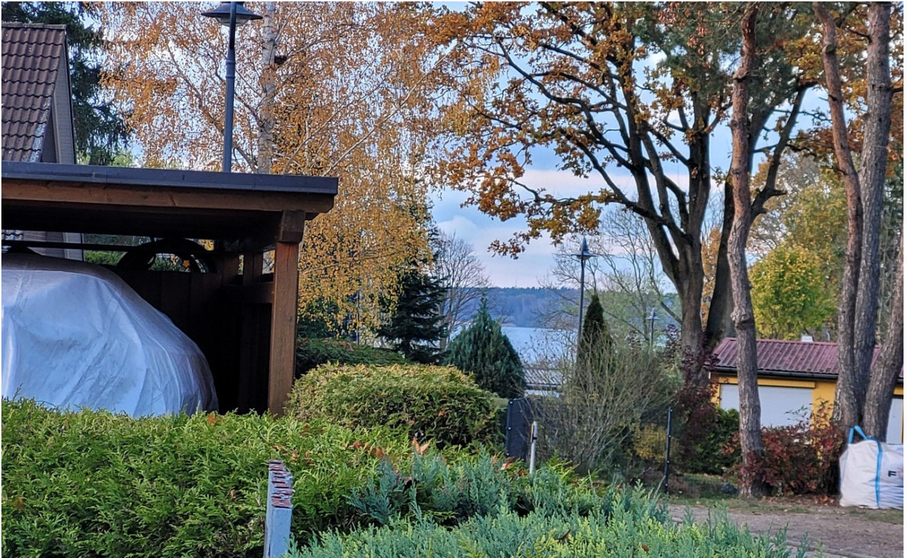
bischen Seeblick nach vorne