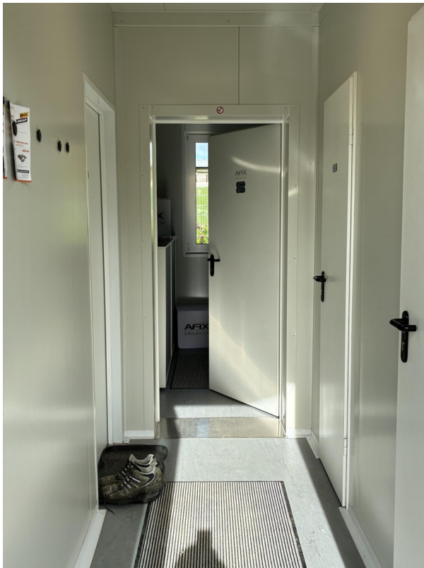
Flur des Bürocontainer