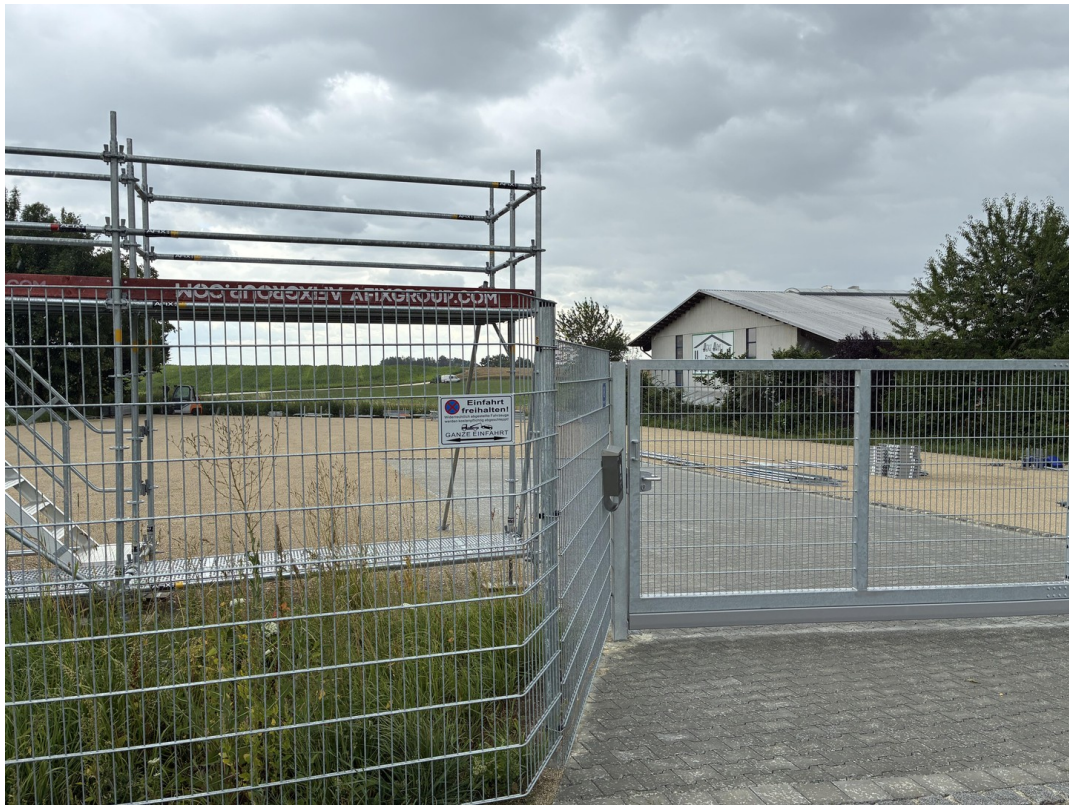
Einfahrt mit Schiebetor