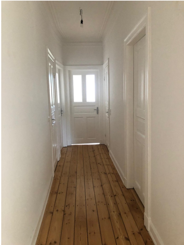
Flurblick vom Eingang