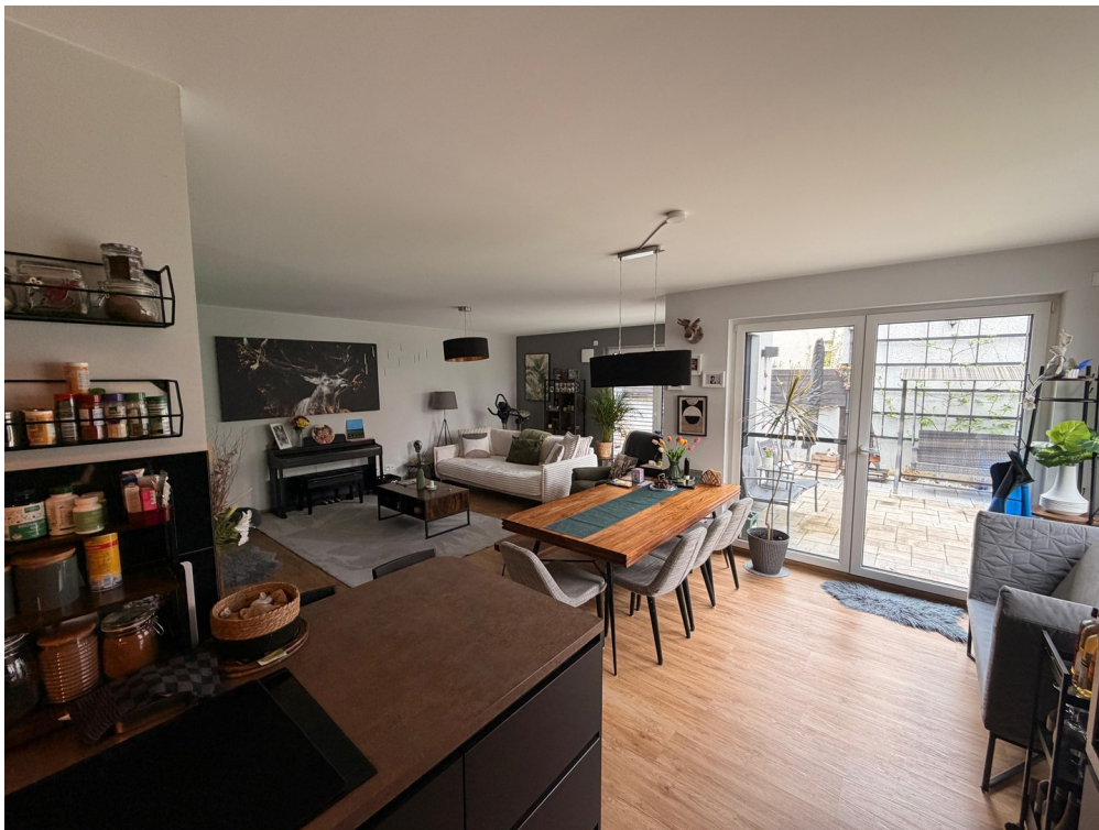
Küche, Wohnzimmer, Esszimmer