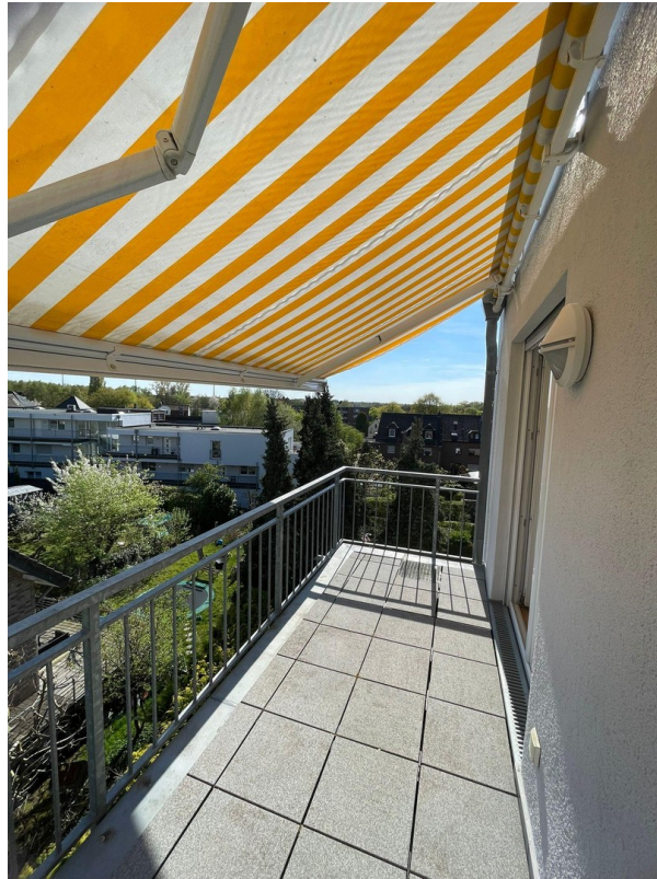
Südbalkon incl. Markise