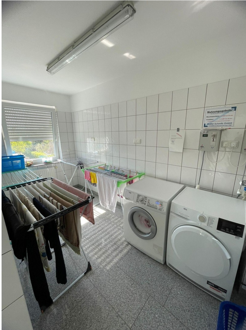
seperat.Waschraum (bei Bedarf)