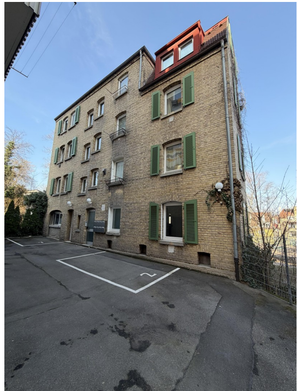
Haus von außen