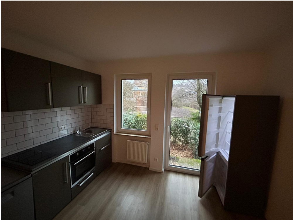
Küche mit Gartenausgang