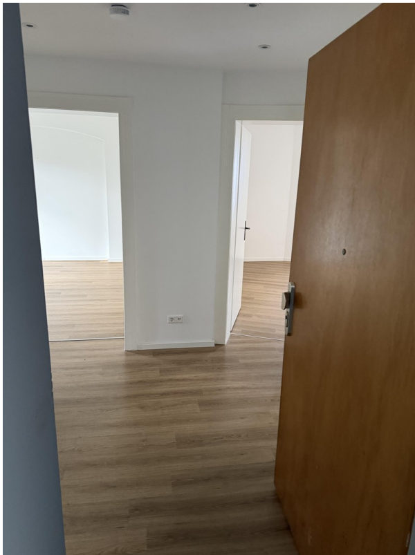
Wohnungseingang in den Flur