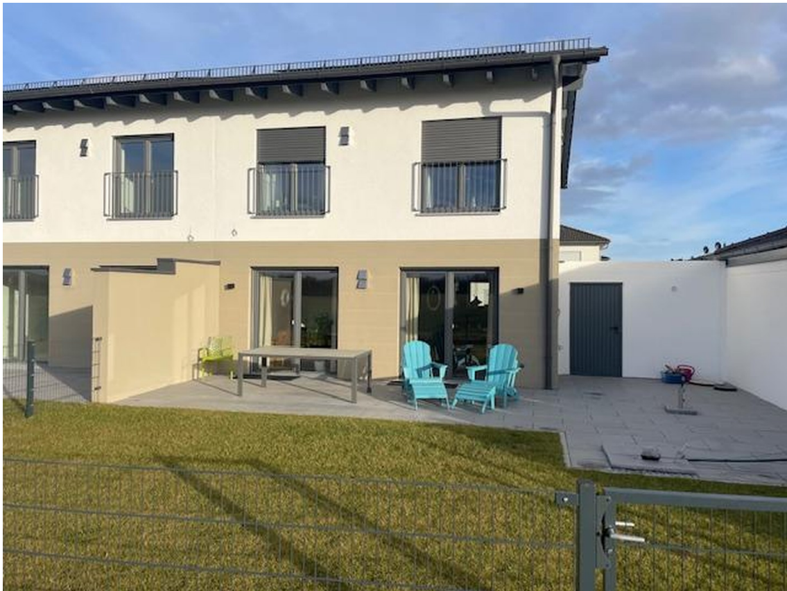
Terrasse, West Seite