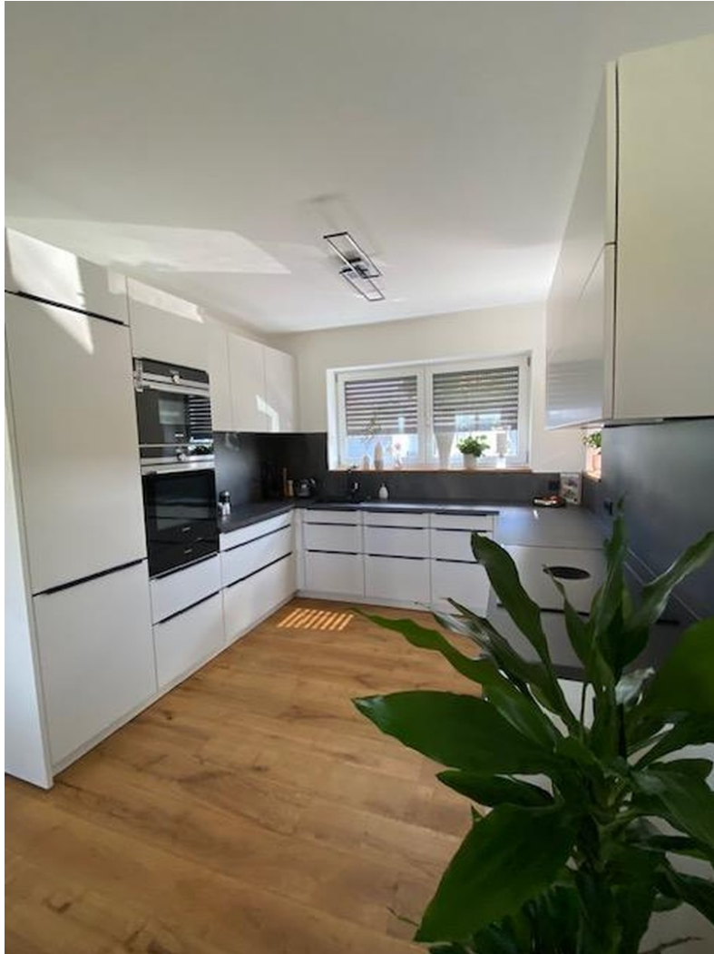
Hochwertige Küche (Ablösung)