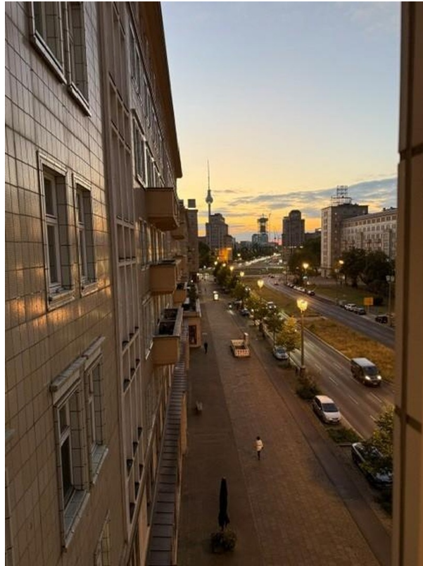
Zi. Fernsehturm Sundowner