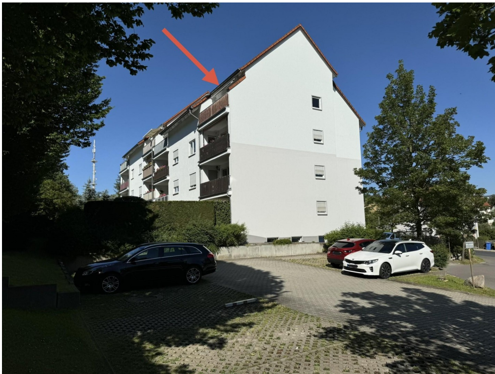
Stellplatz + Wohnung