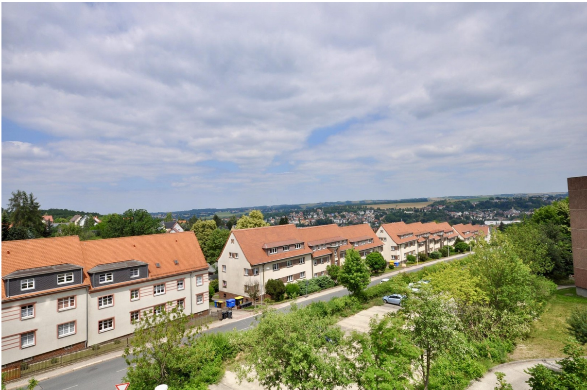
Aussicht Richtung Straße