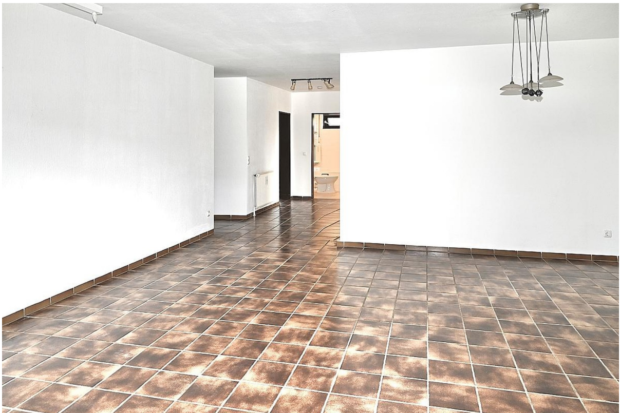
Wohn- / Esszimmer Blick zur Di