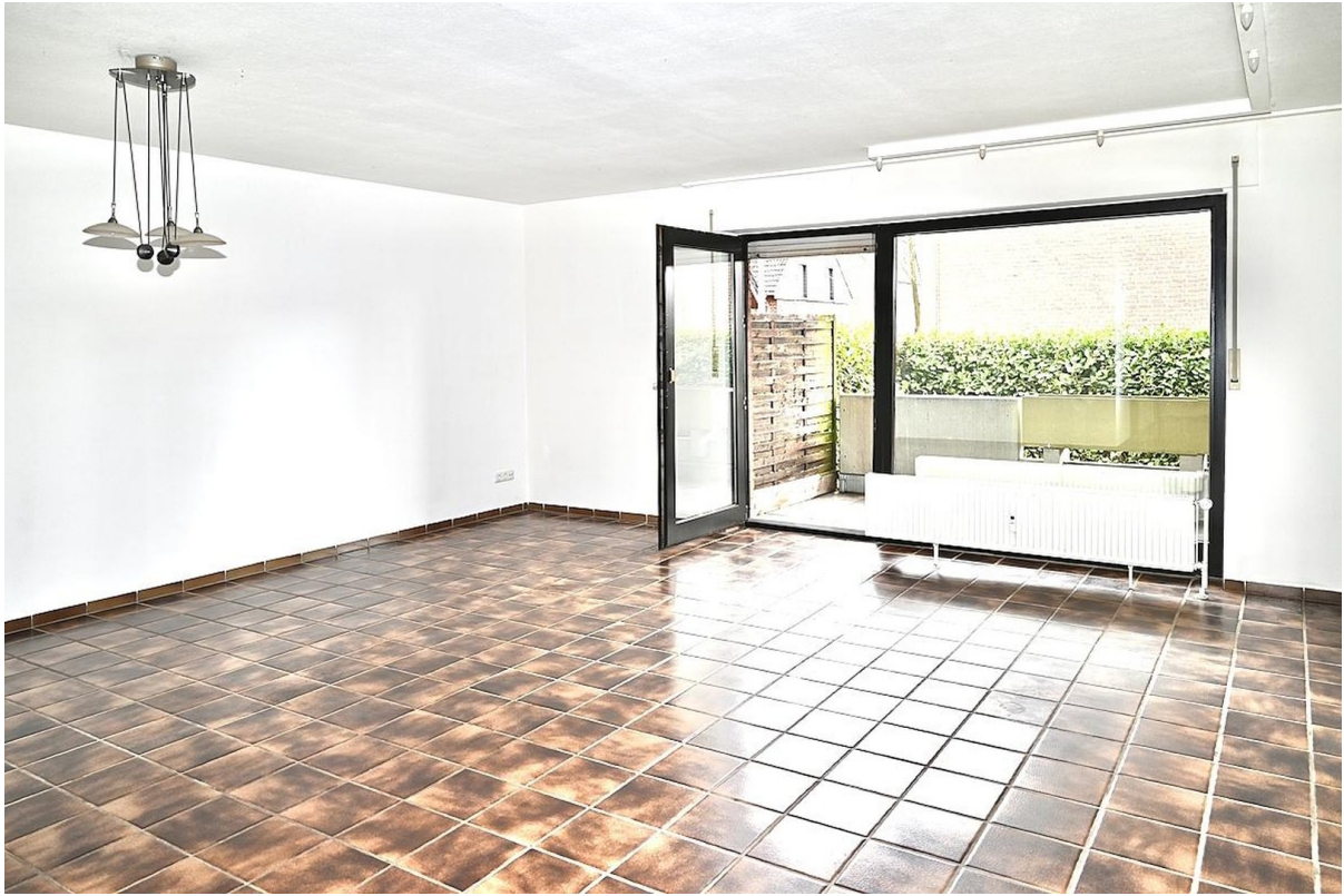
Wohn- / Esszimmer Blick zum Ba