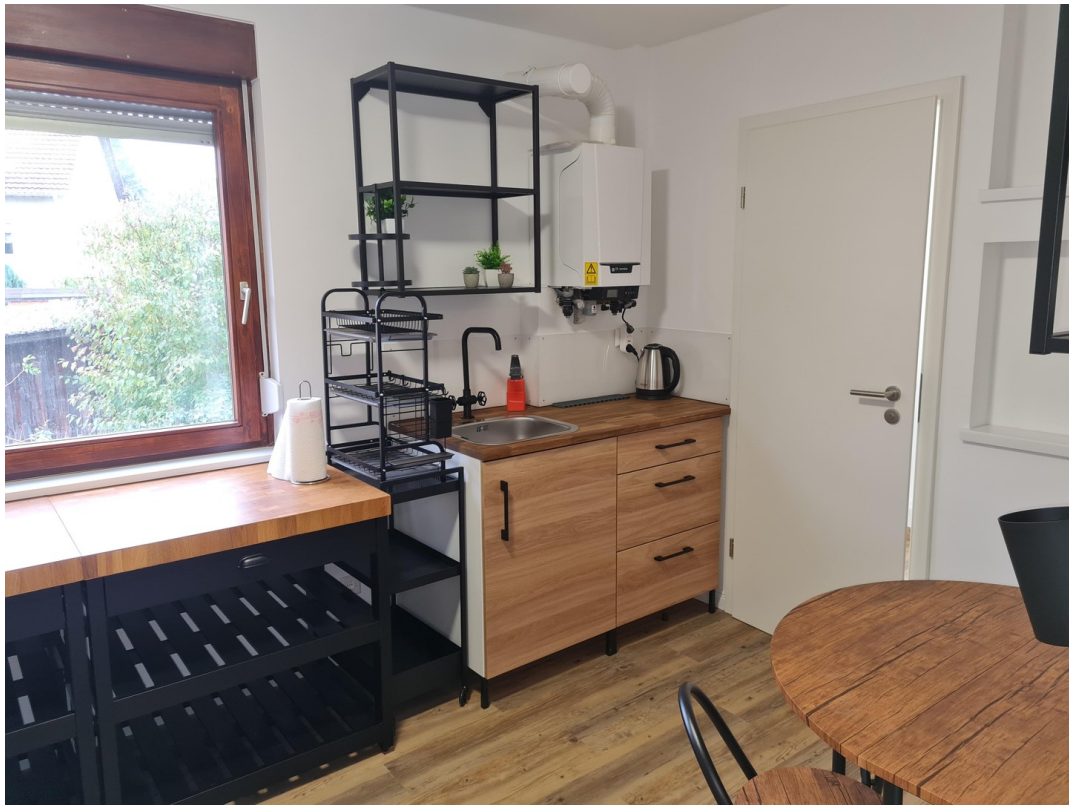
Voll eingerichtete Küche