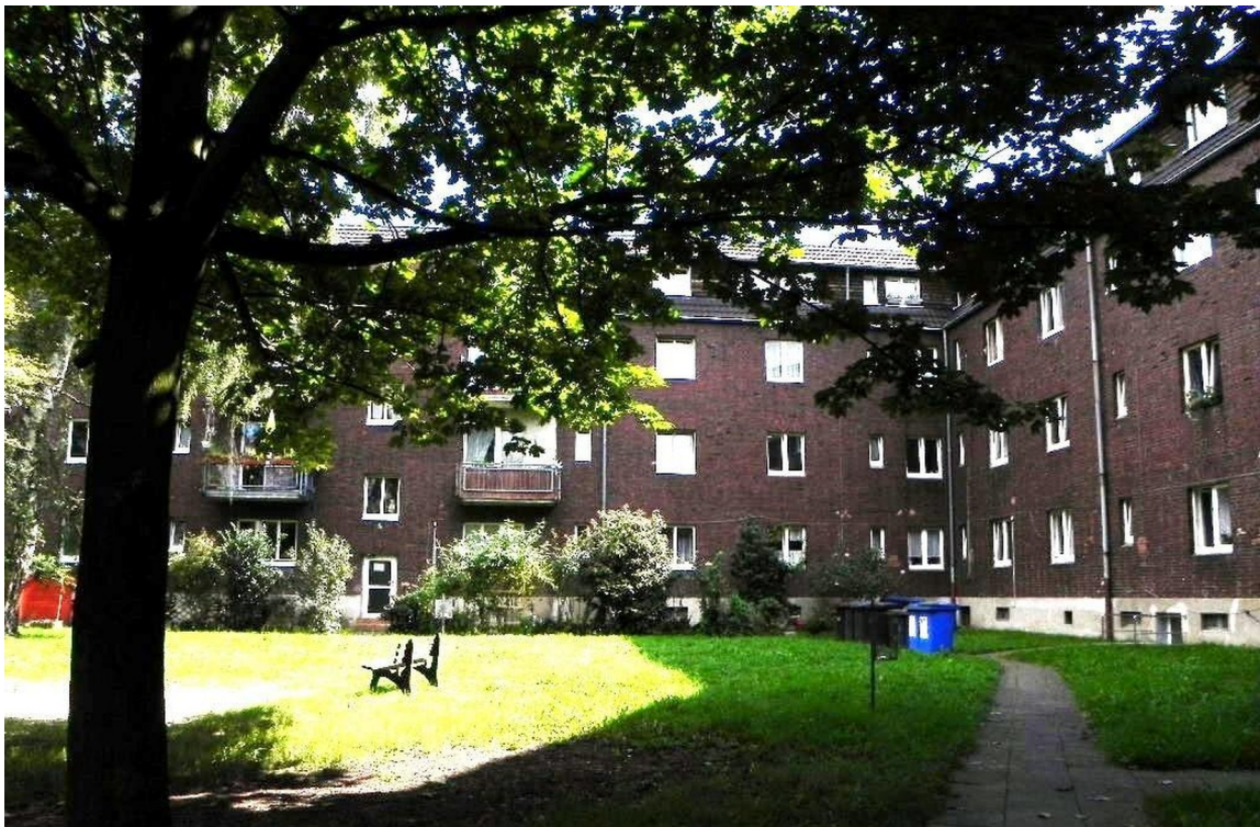
Grünbereich hinter dem Haus