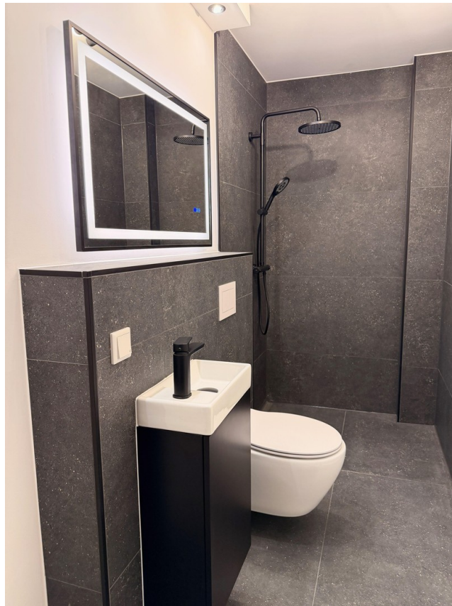
Dusch Bad Erdgeschoss