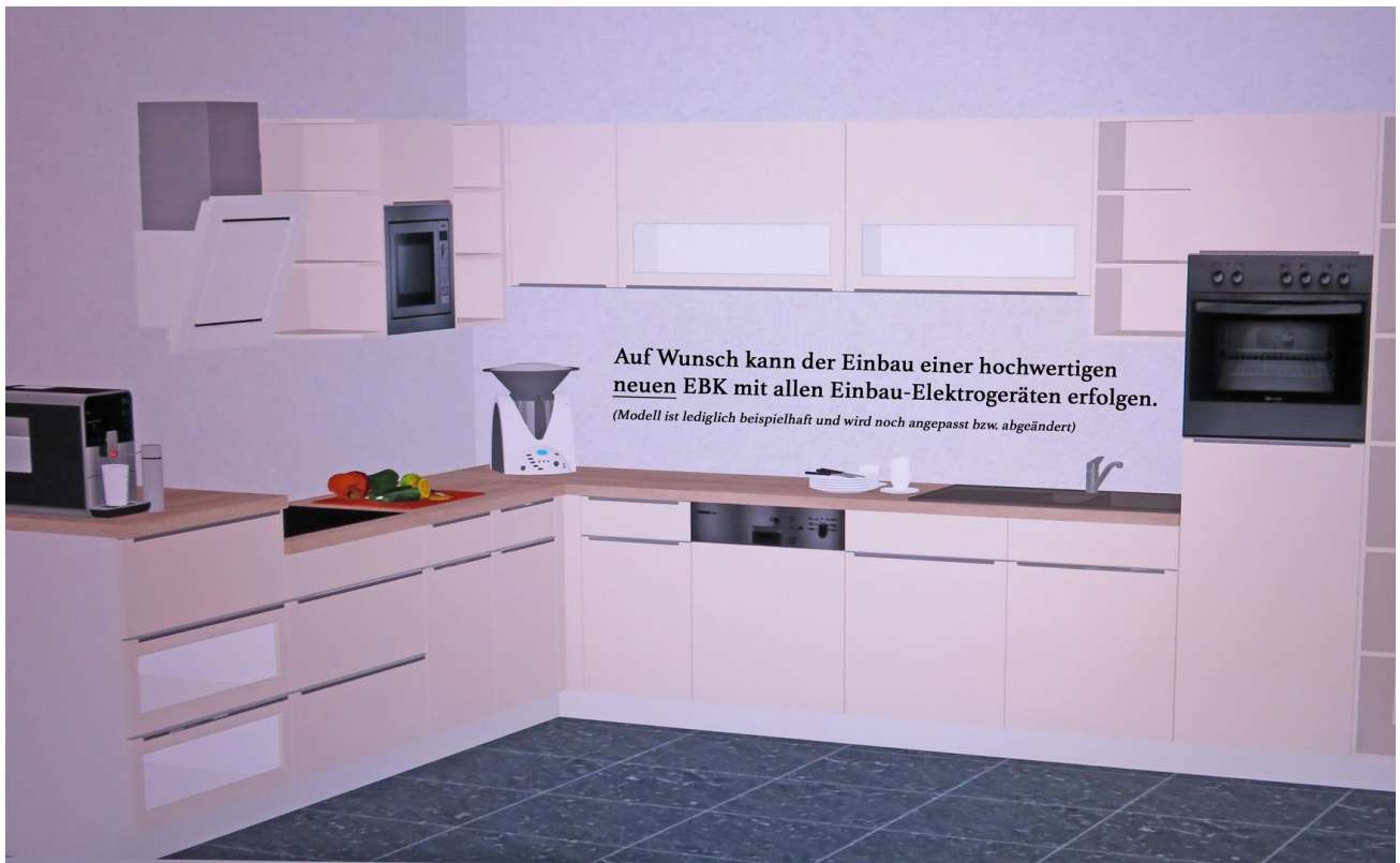
Optionale EBK (neu) 1