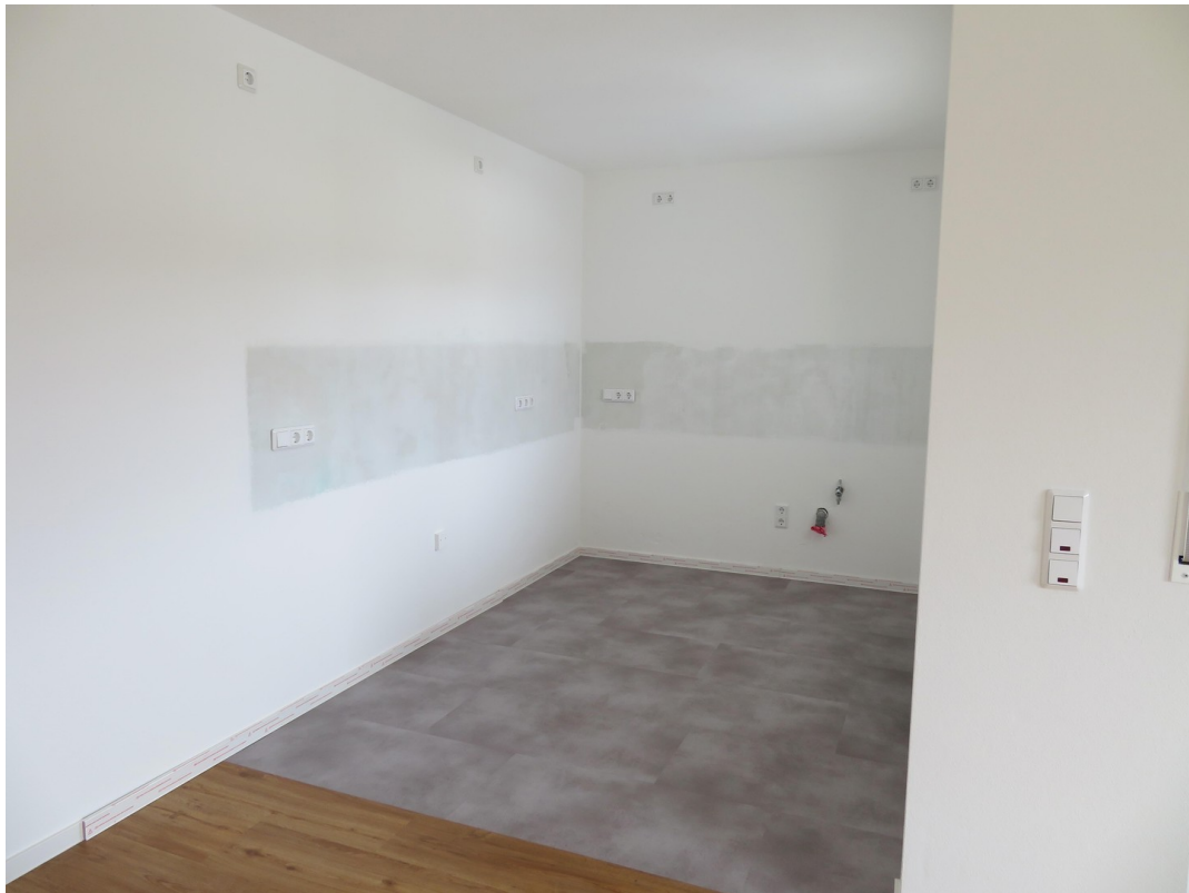
Offene Küche 2