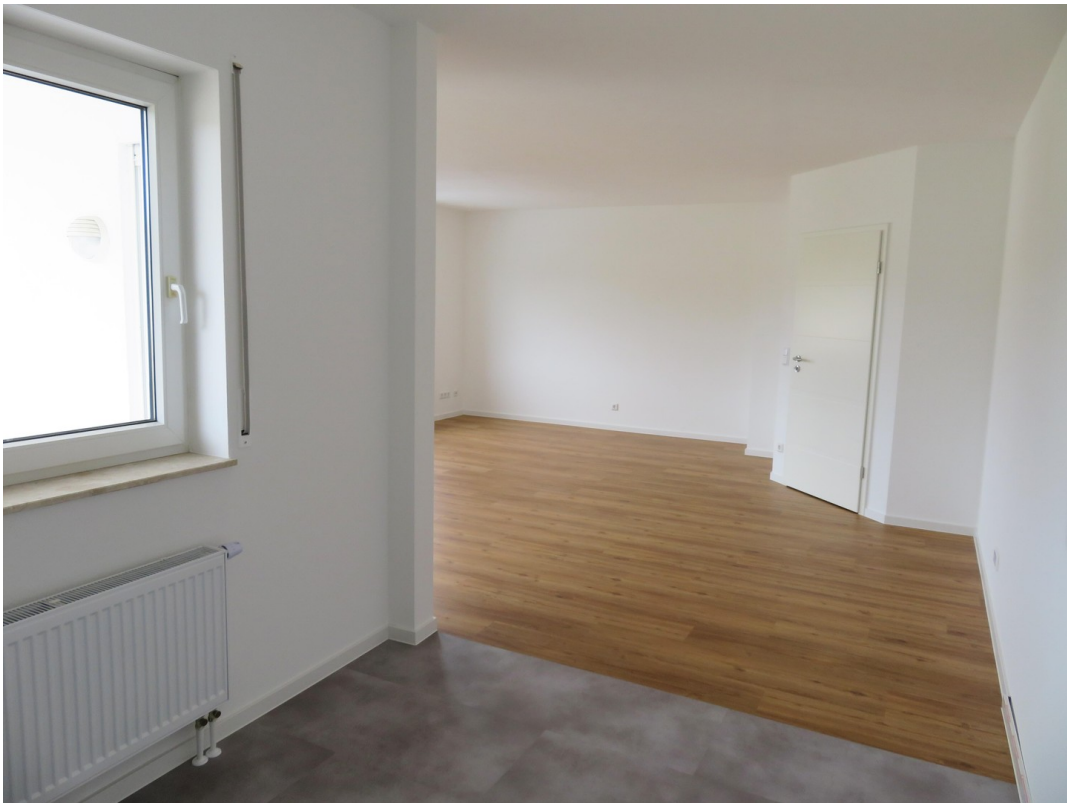
Offene Küche 1