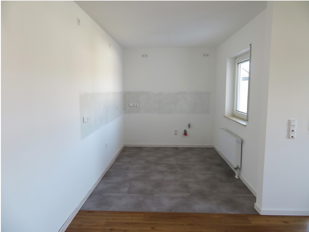
Offene Küche 3