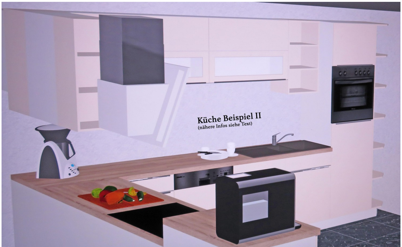
Optionale EBK (neu) 2