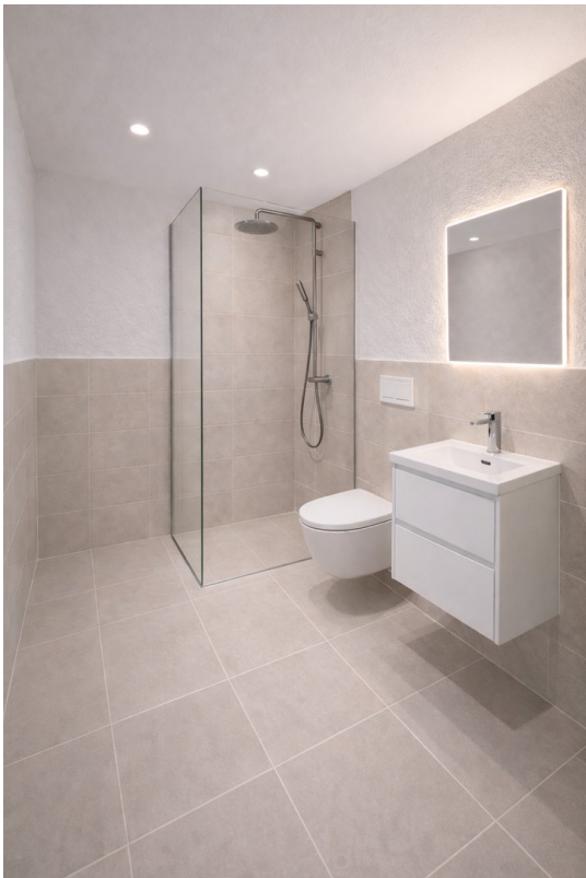
Badezimmer mit WC