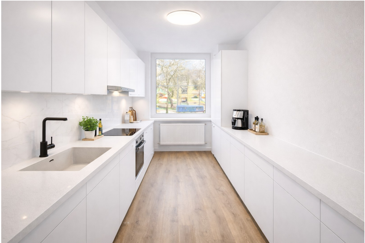
Küchenbeispiel - KI generiert