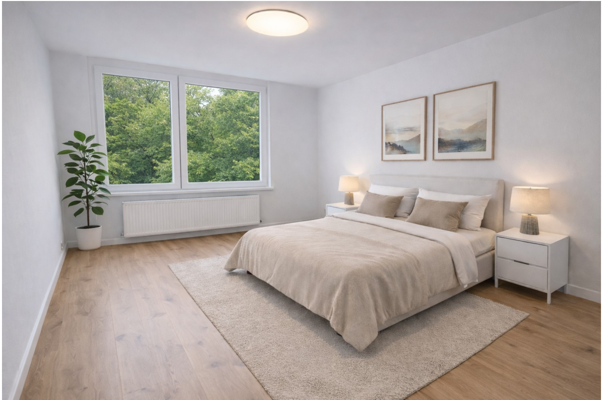
Schlafbsp. - KI generiert