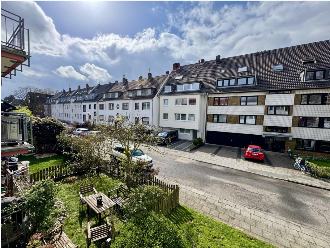
Sonniger Ausblick - Sackgasse