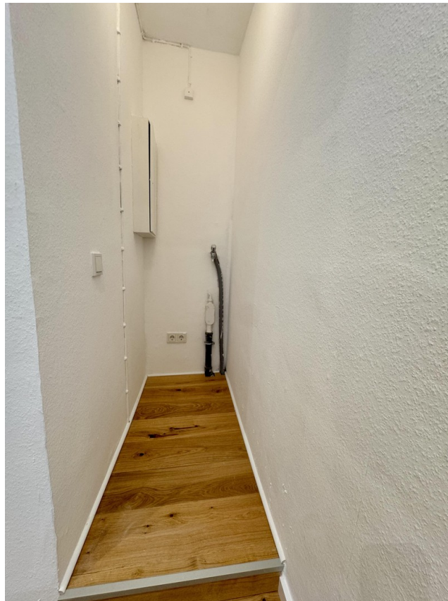
Nische für WM