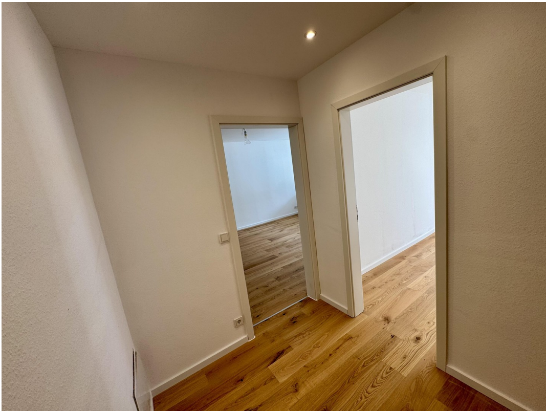
Flur mit Spots