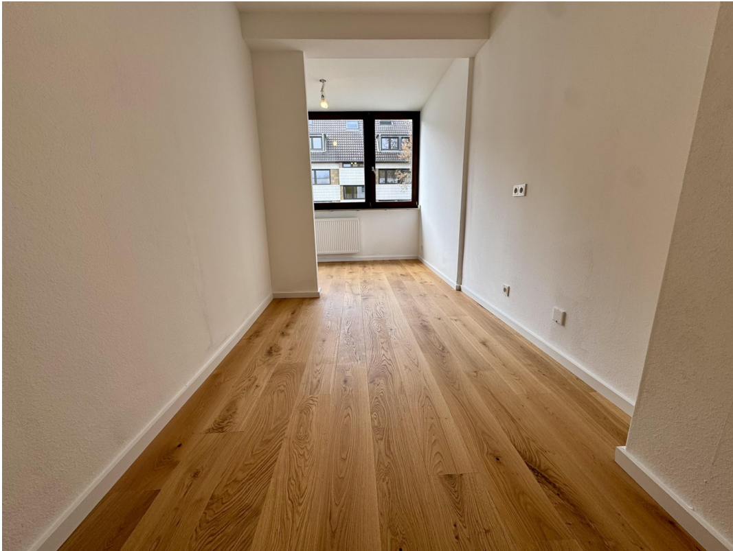
Küche / Durchbruch WoZi mgl.