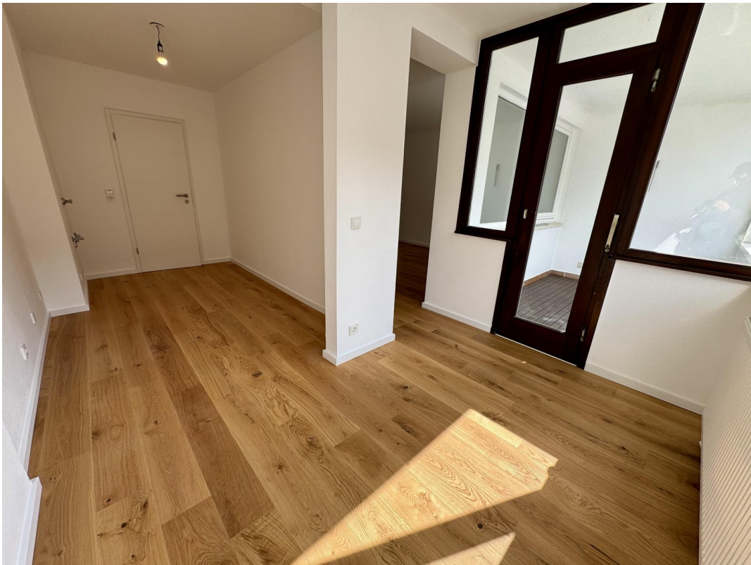
Küche - Durchbruch möglich