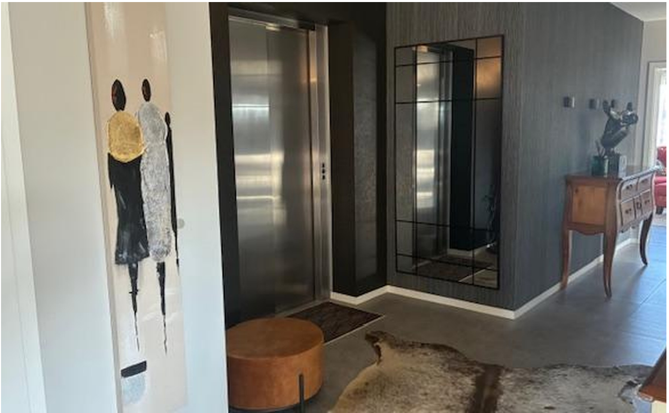
Aufzug in die Wohnung