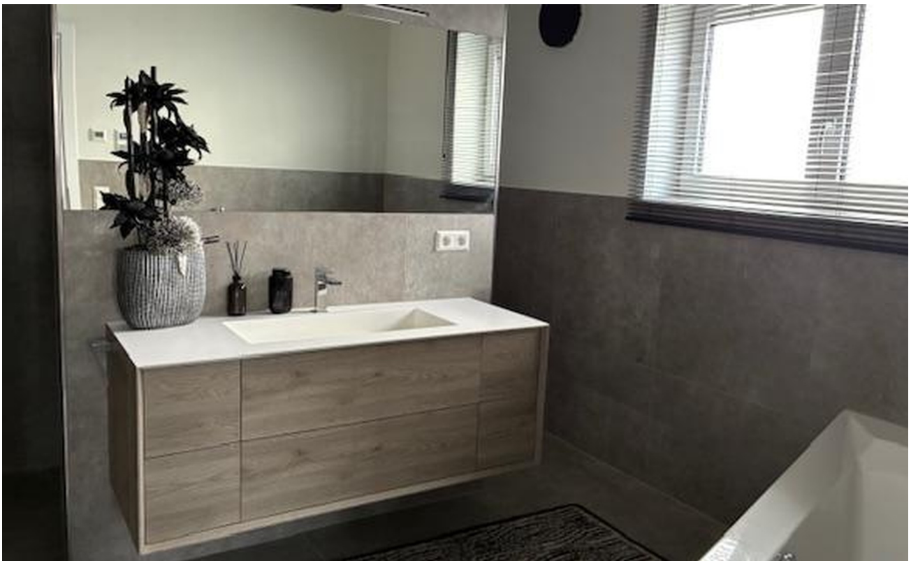
Bad en Suite