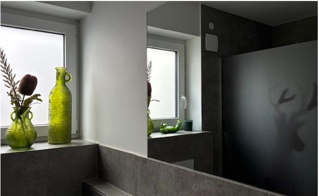
Gäste Bad mit Dusche und WC