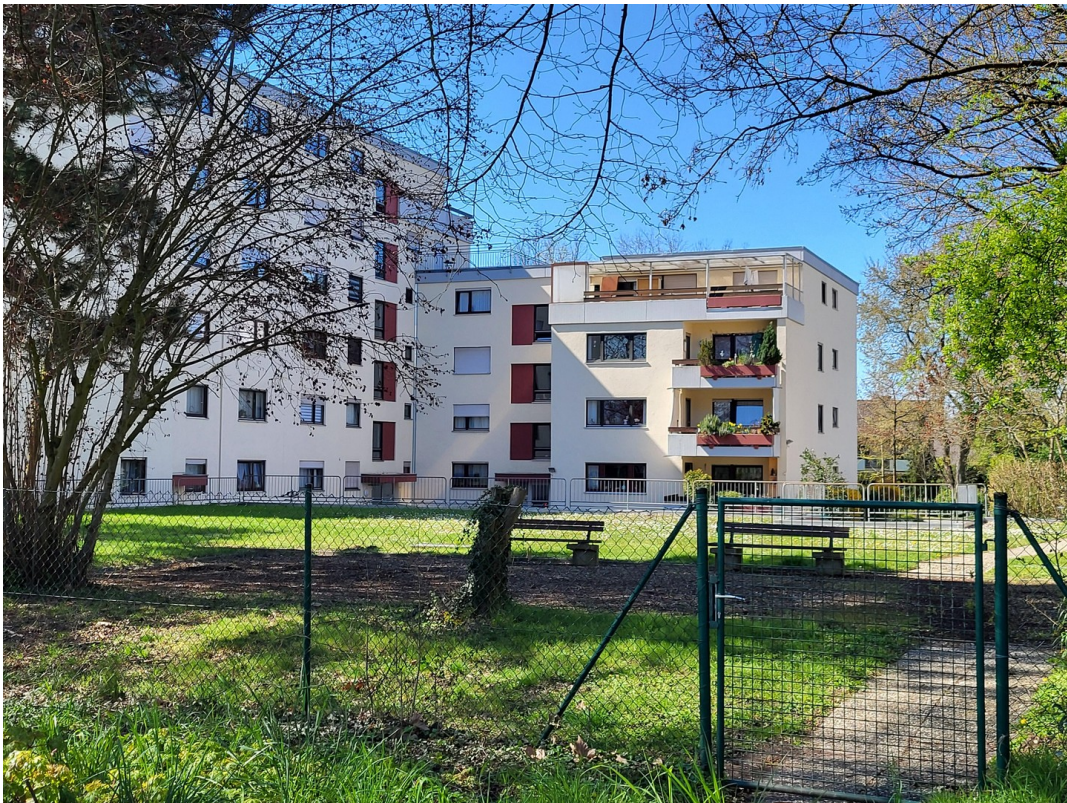
Rückansicht Zugang Murgdamm