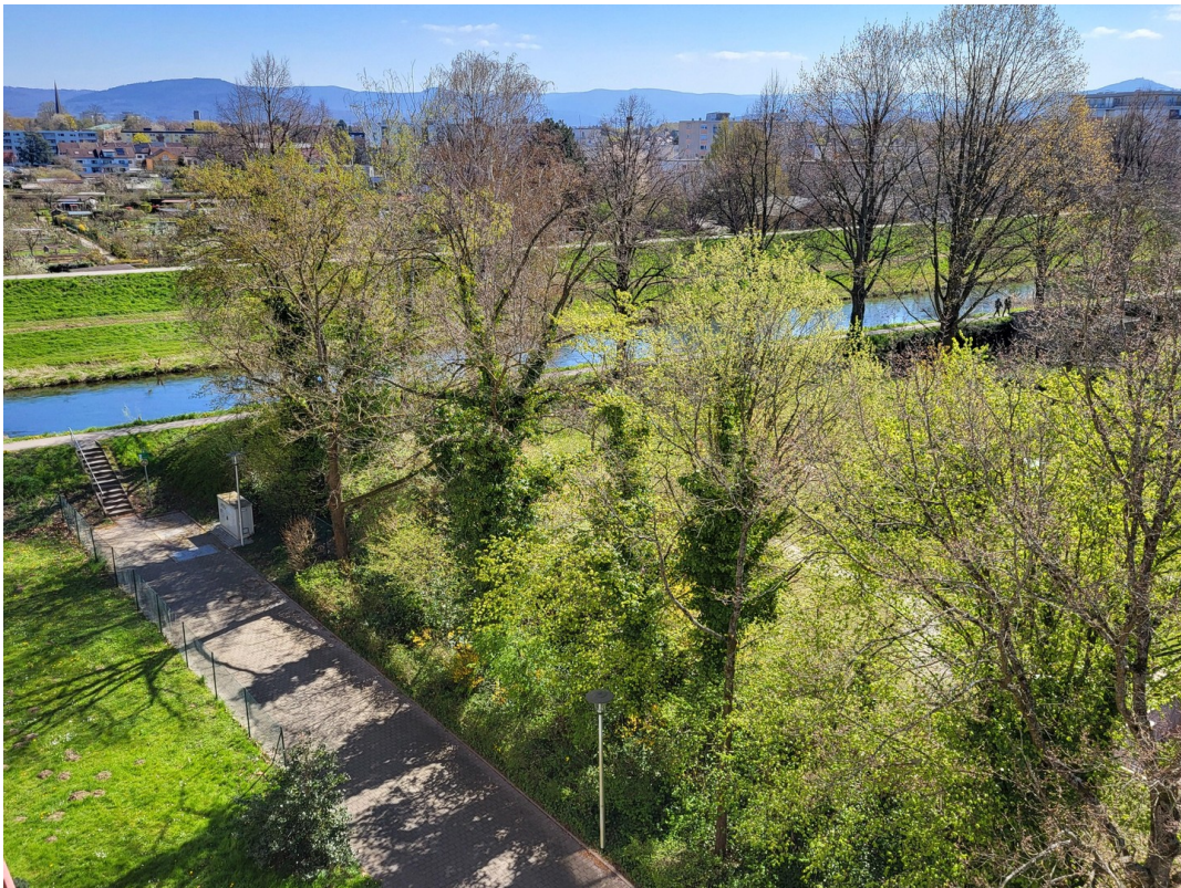
Zugang öffentl. Gehweg