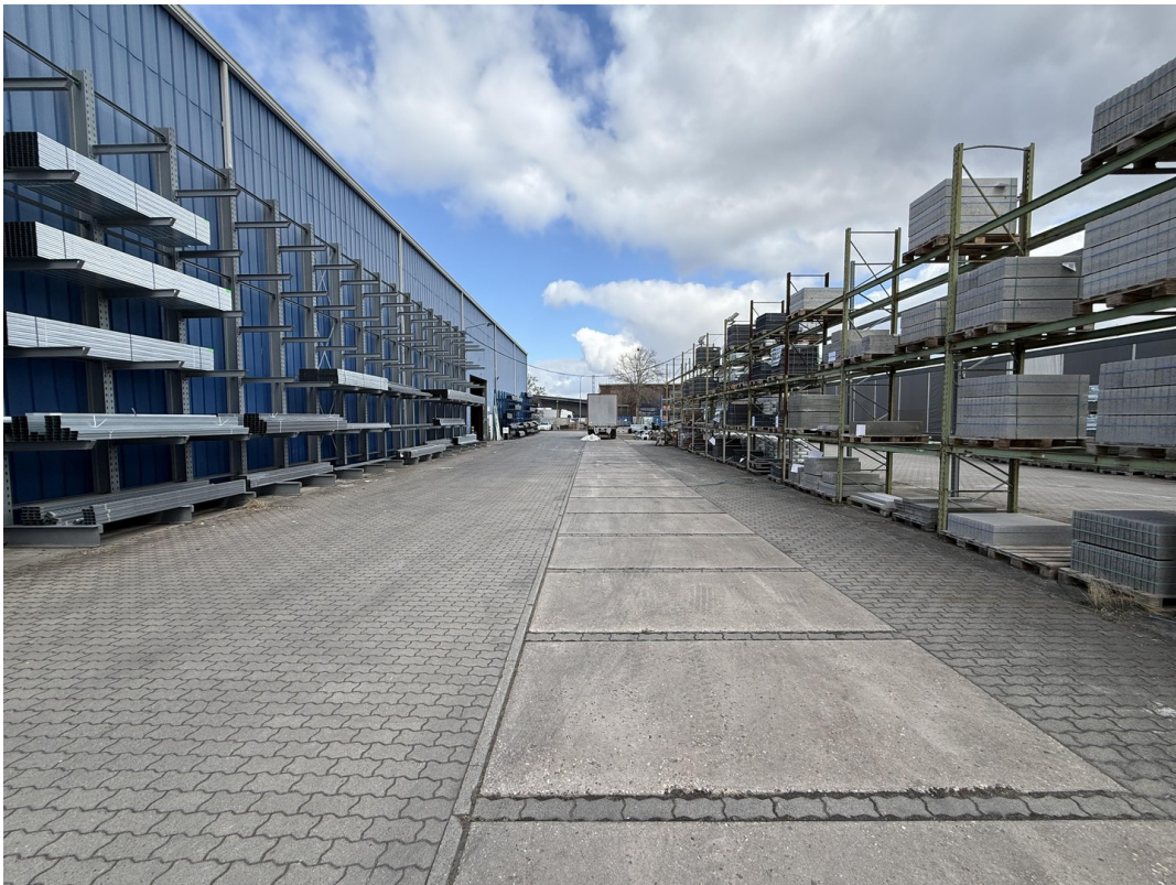
Freigelände / Lagerfläche