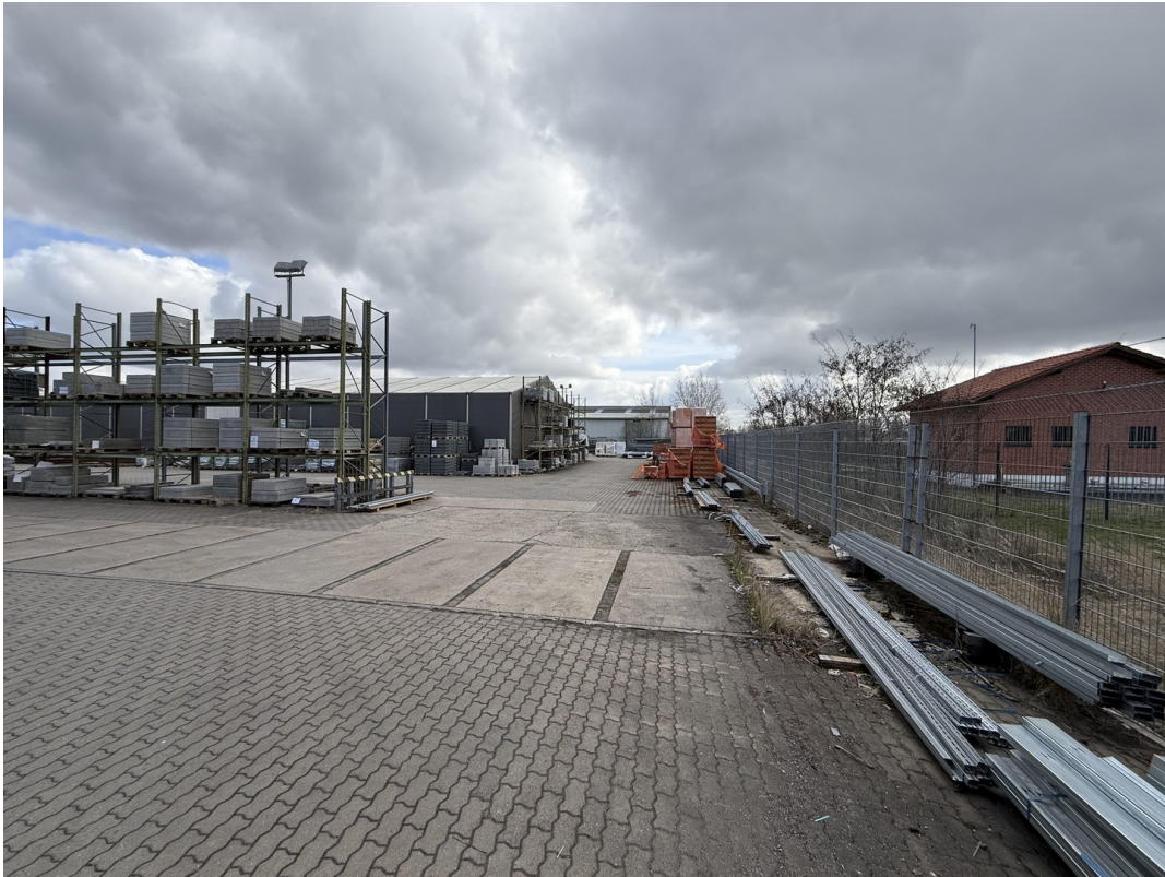
Freigelände / Lagerfläche