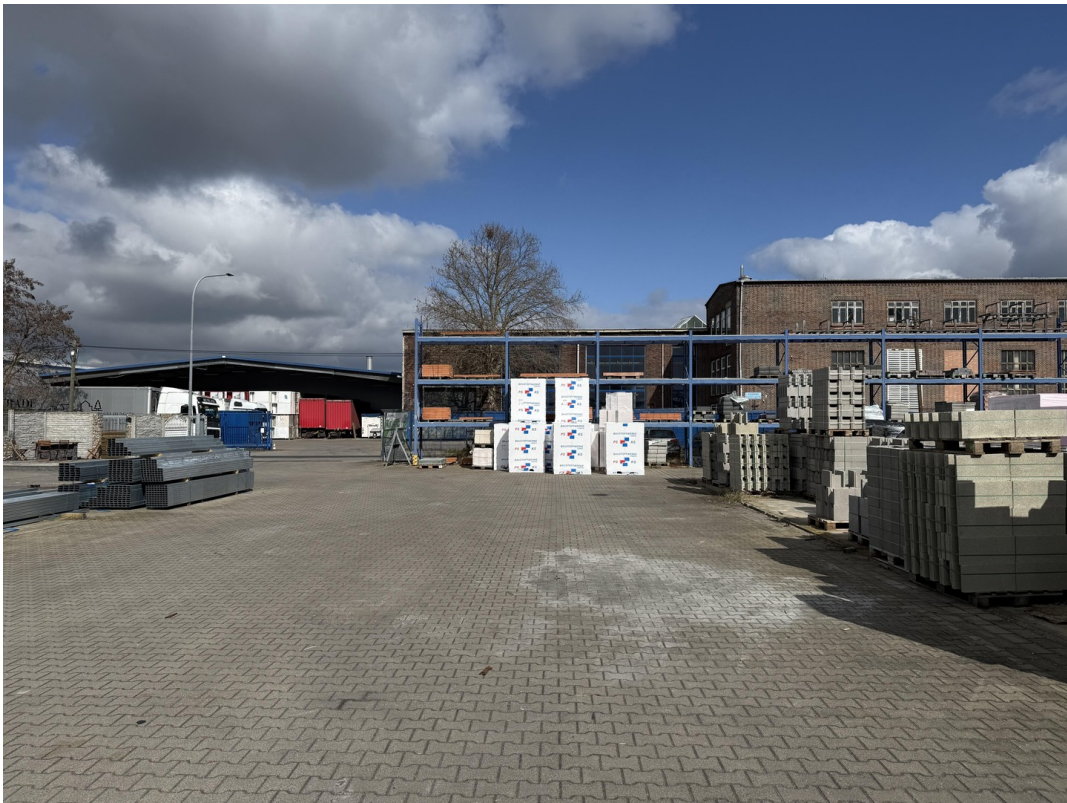
Freigelände / Lagerfläche