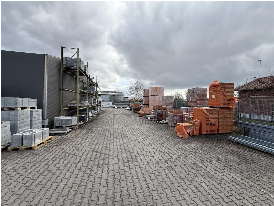
Freigelände / Lagerfläche