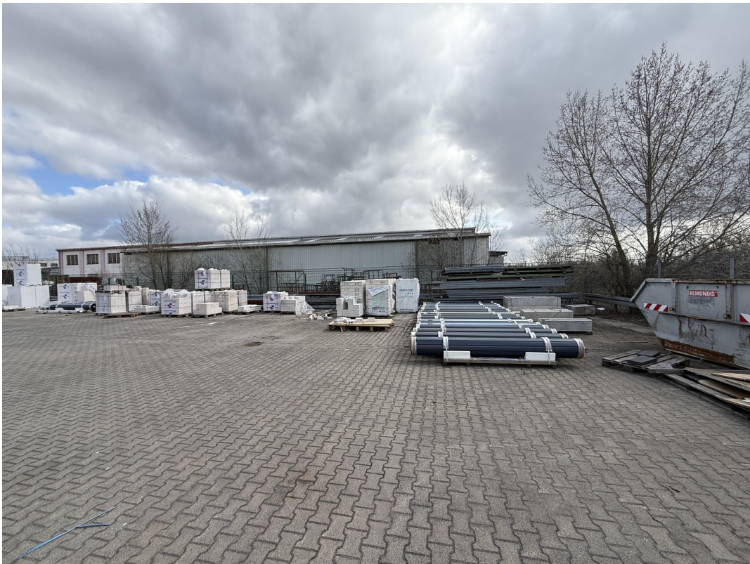
Freigelände / Lagerfläche