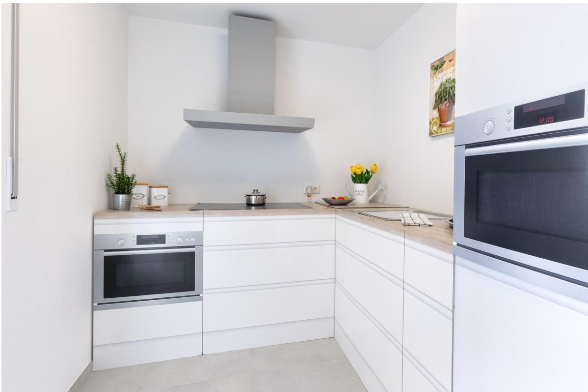
Küche (nur Requisite!)