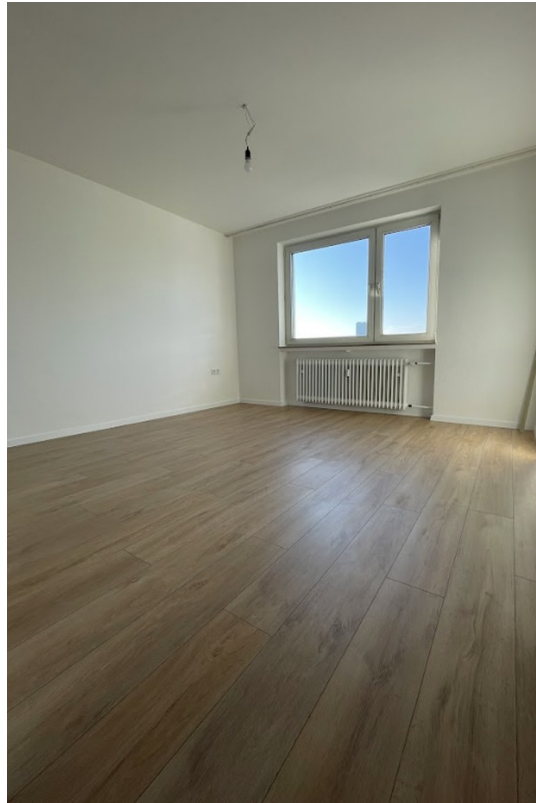
Zimmer 2 Blick zum Fenster