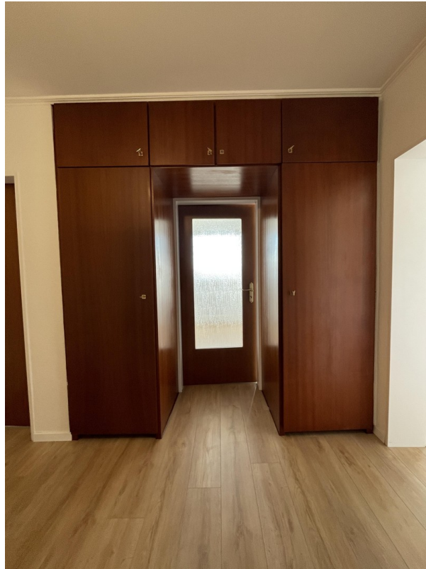
Einbauschränk im Flur