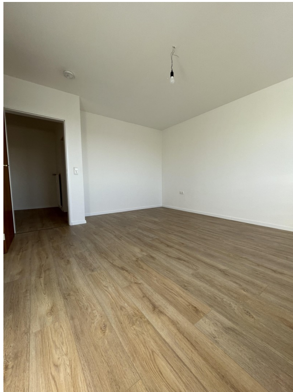
Zimmer 2 Blick zur Tür