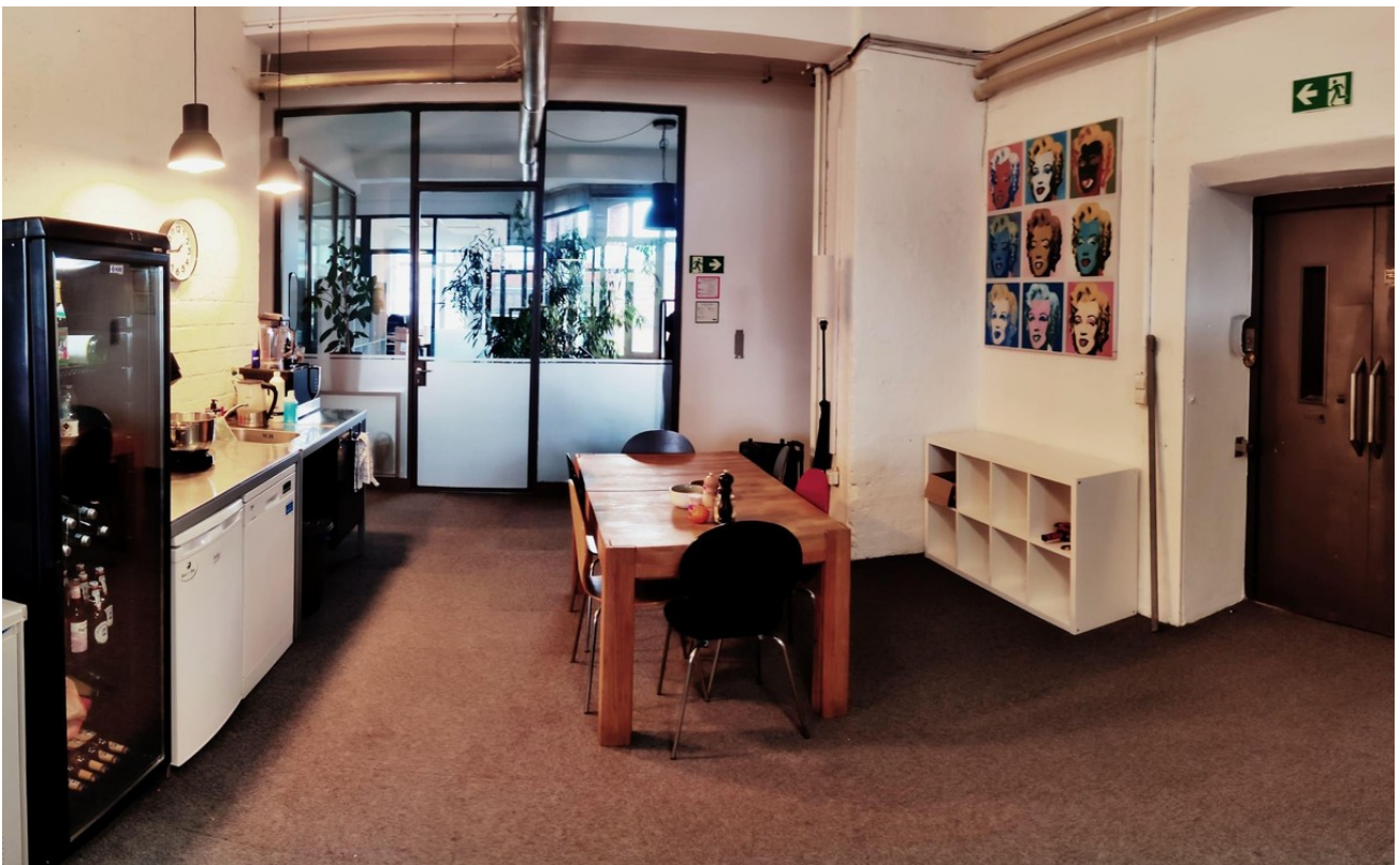
Aufenthaltsraum mit Aufzug