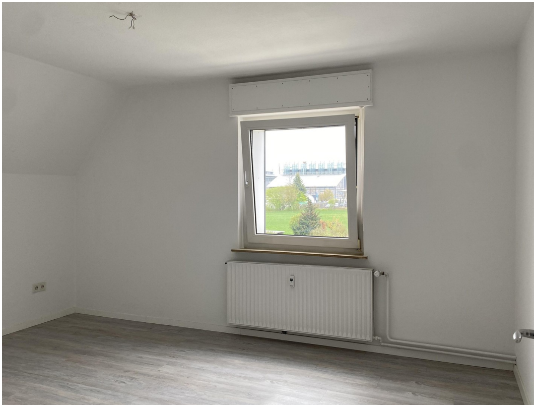
Raum 3, OG