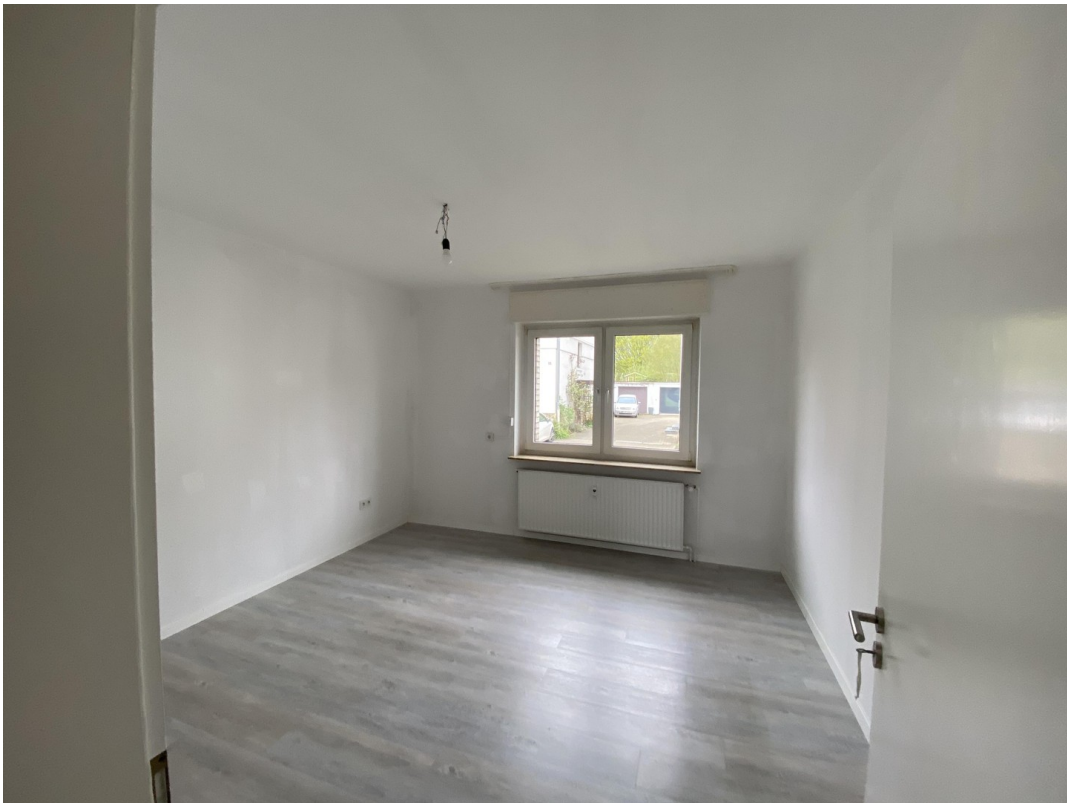
Raum 2, EG