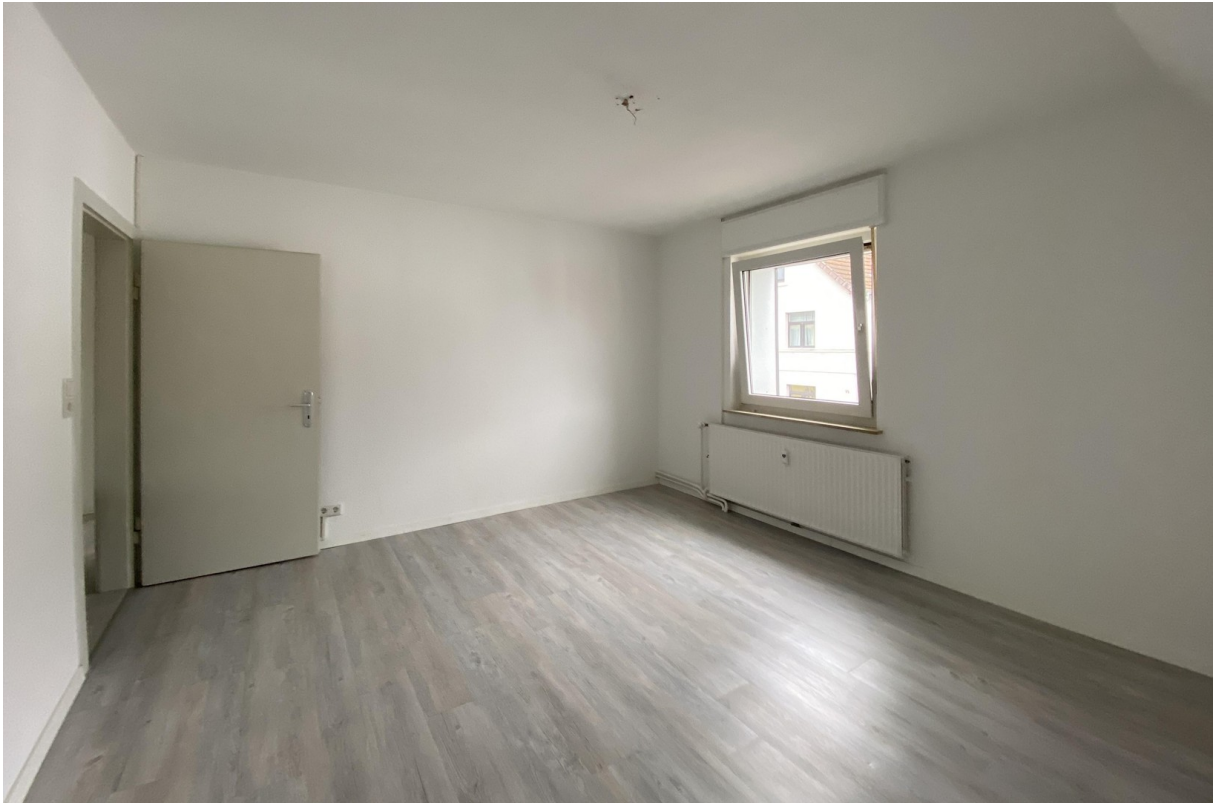
Raum 1, OG