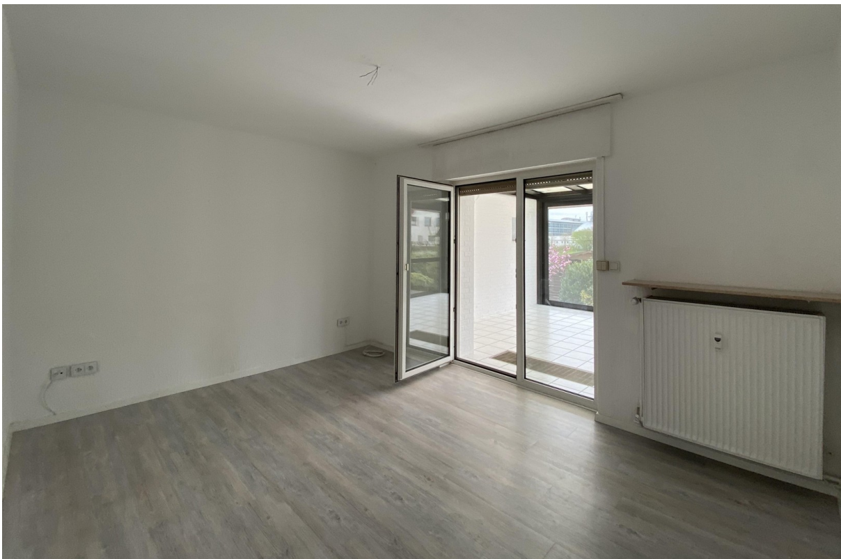
Raum 3, EG - Zugang Wintergar.