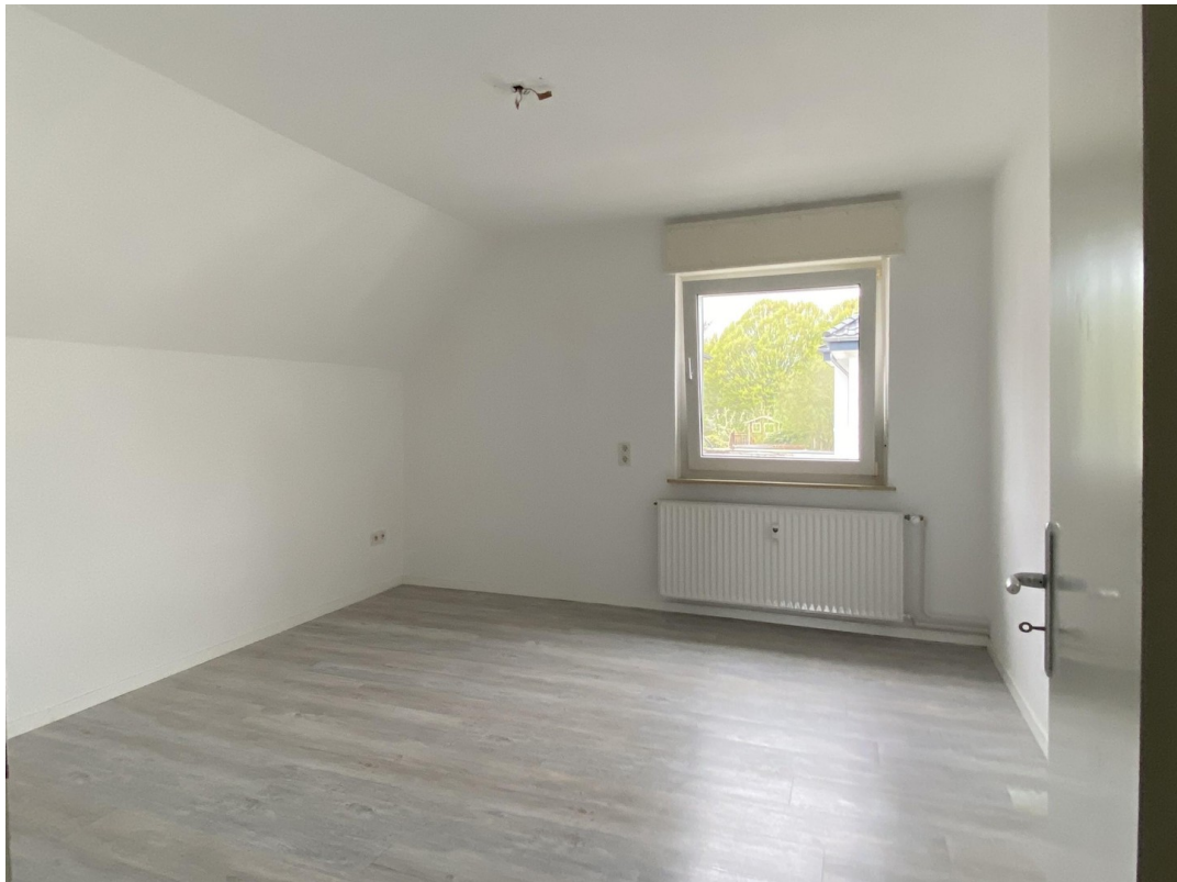
Raum 2, OG