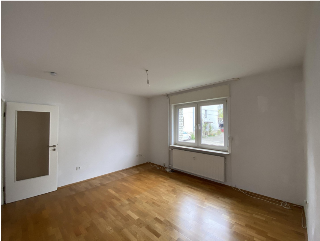
Raum 1, EG