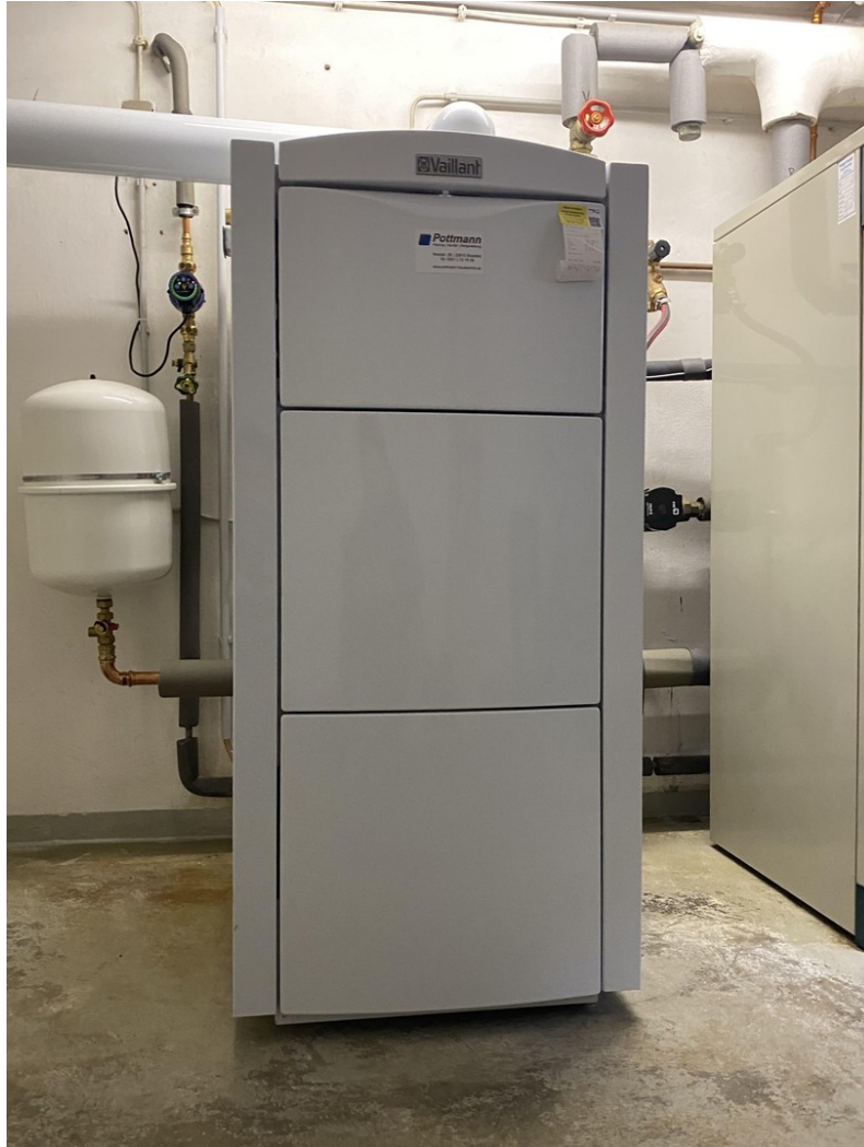
Zentrale Gasheizung, BJ. 2023