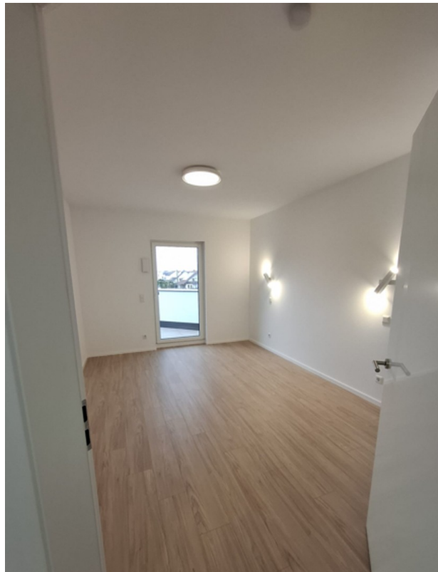
Schlafzimmer mit Balkonausgang