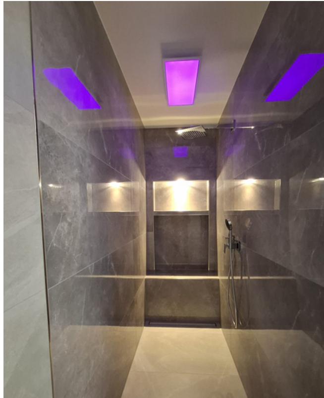
Bad/ Begehbare Dusche