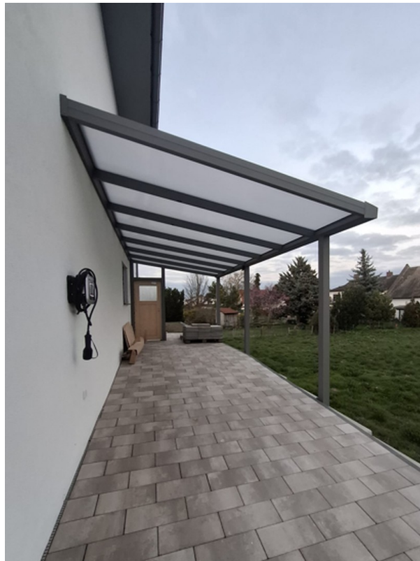
Carport mit Ladestation