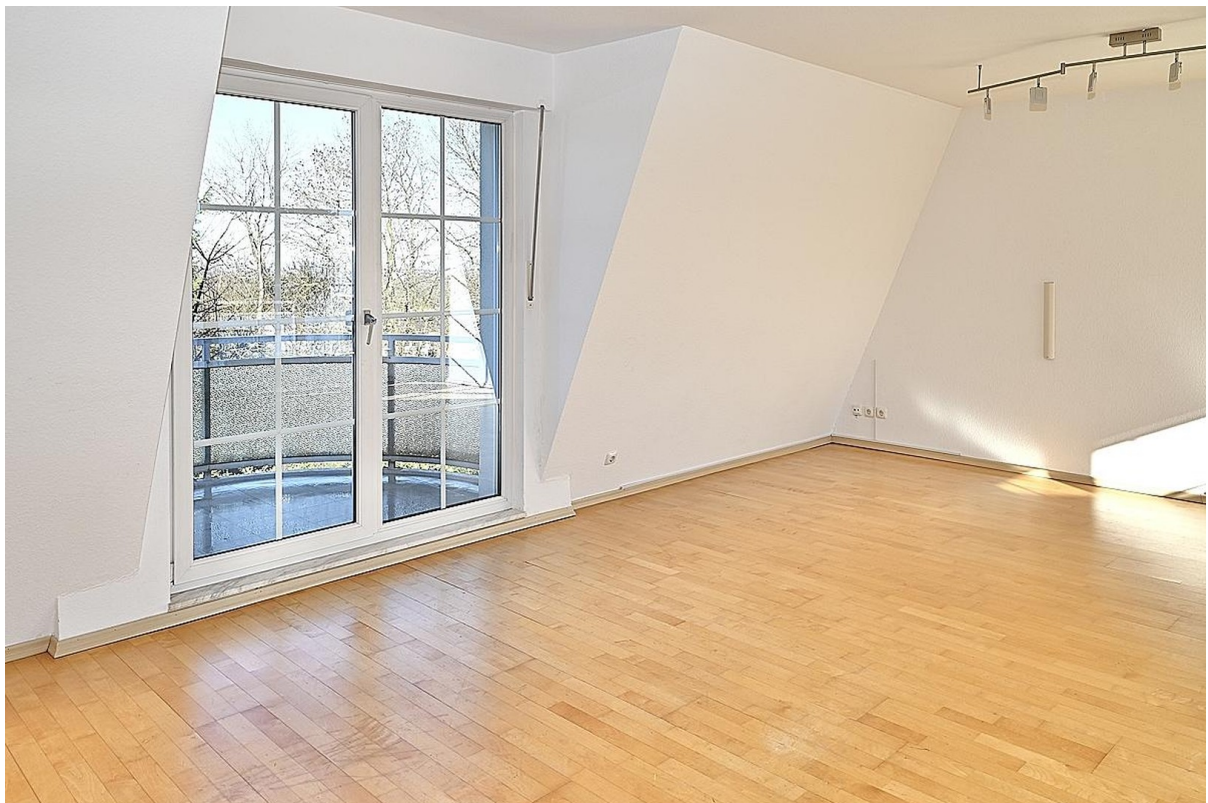
Wohnzimmer Zugang 1. Balkon