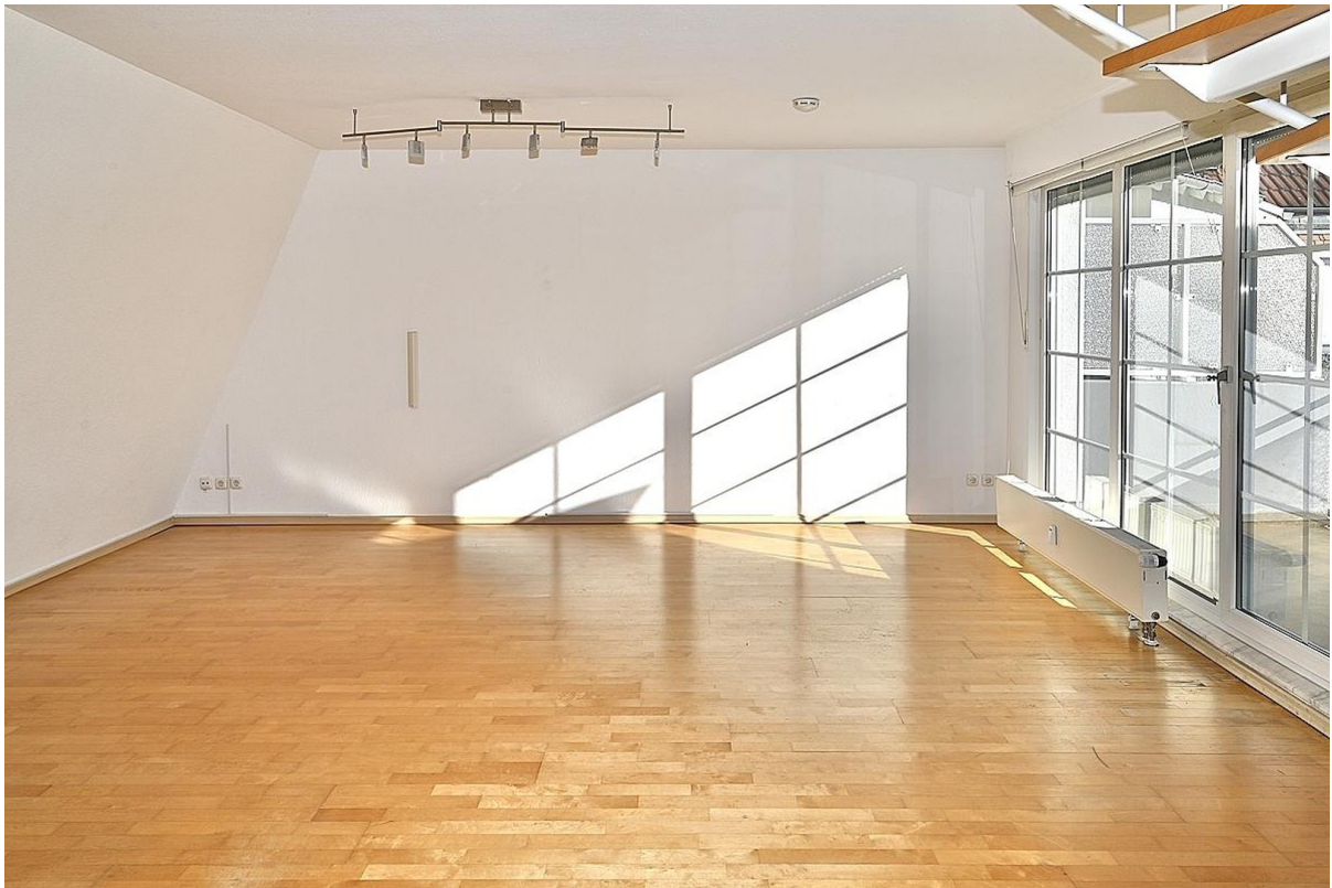
Wohnzimmer Zugang 2. Balkon