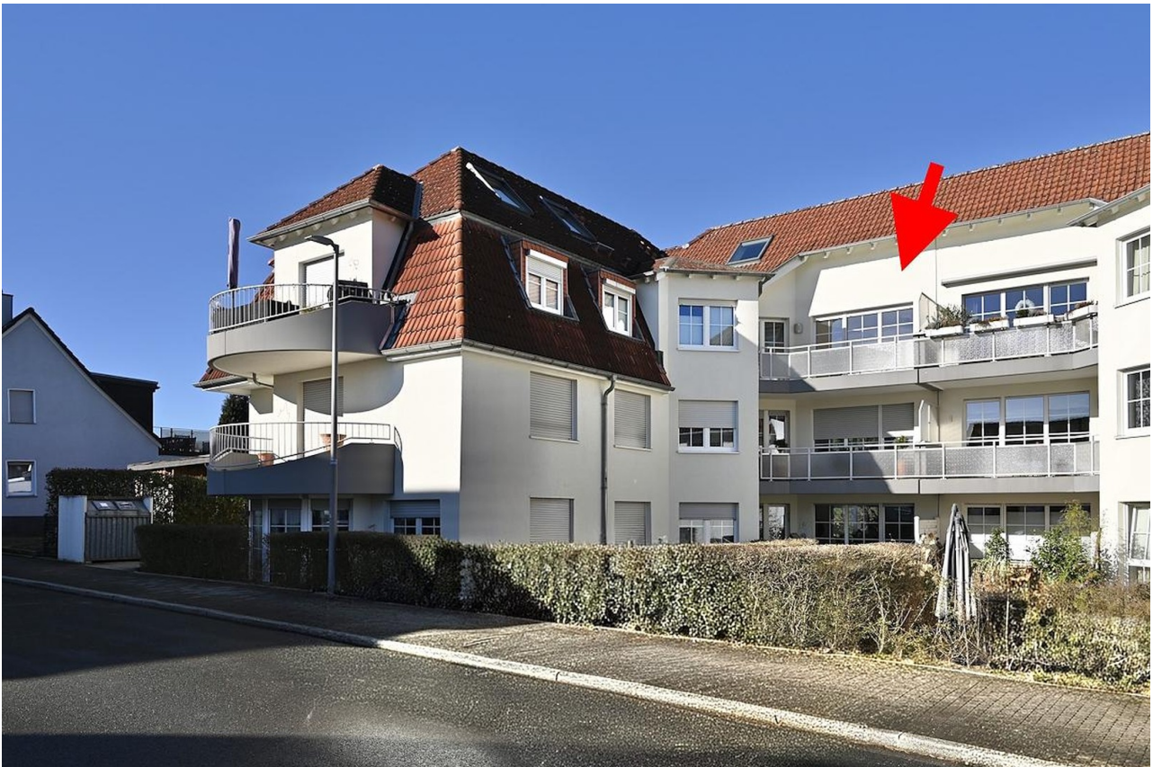
Ansicht auf die Wohnung