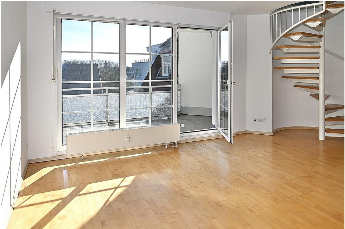
Wohnzimmer Zugang 2. Balkon