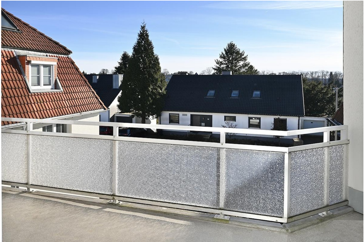
2. Balkon Südausrichtung