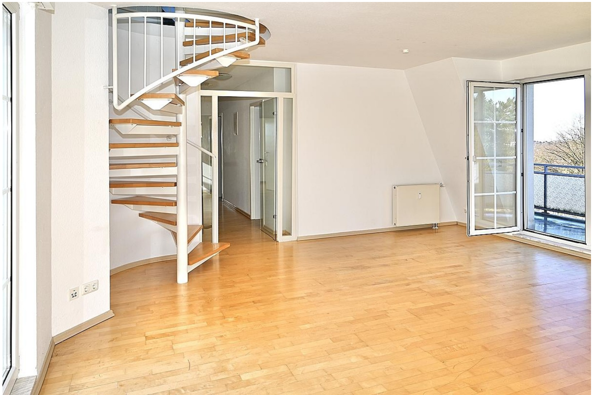
Wohnzimmer mit Treppe zum DG