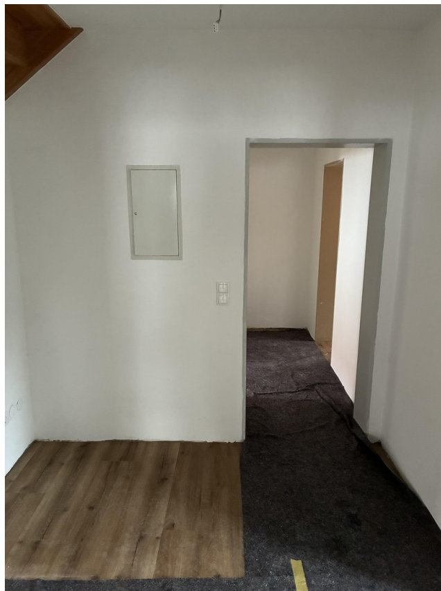
Flur - Bodenerneuerung