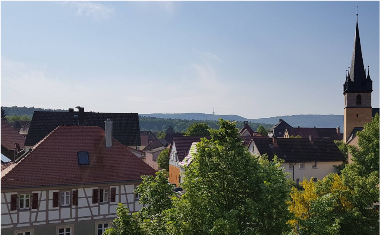
Blick auf Geisfeld