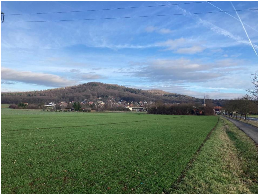
Radweg Bamberg - Geisfeld