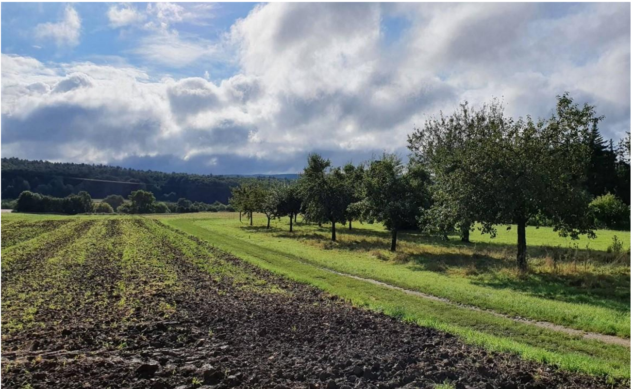
Natur in Geisfeld