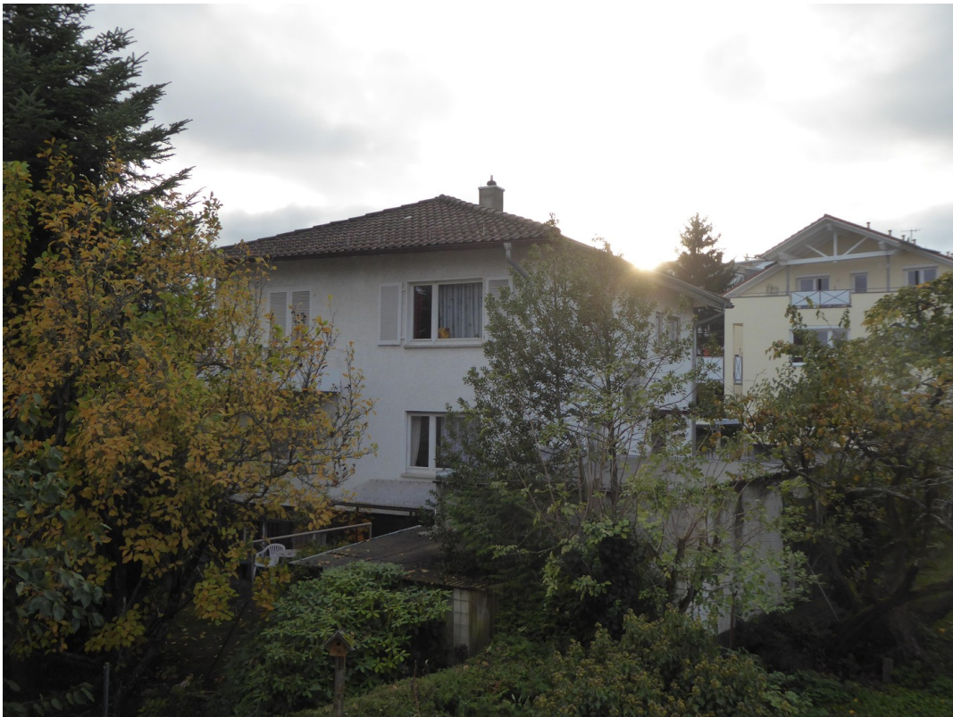
Blick Richtung Süden