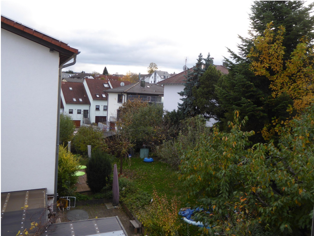
Blick Richtung Süden