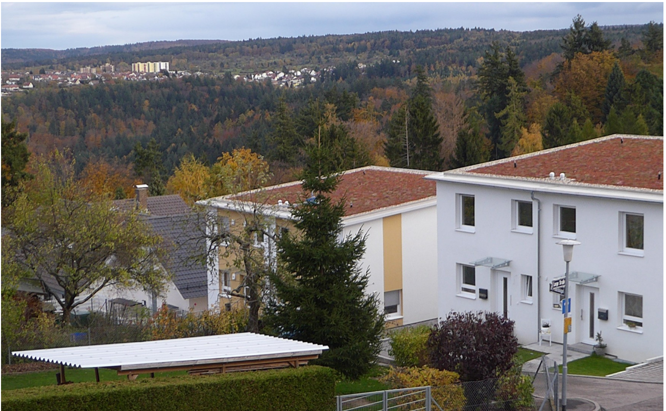
Blick Richtung Süden