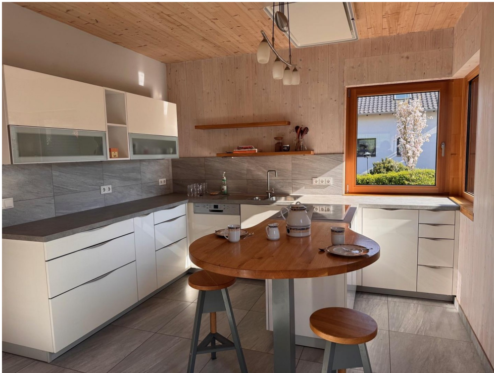
Treffpunkt für Geniesser