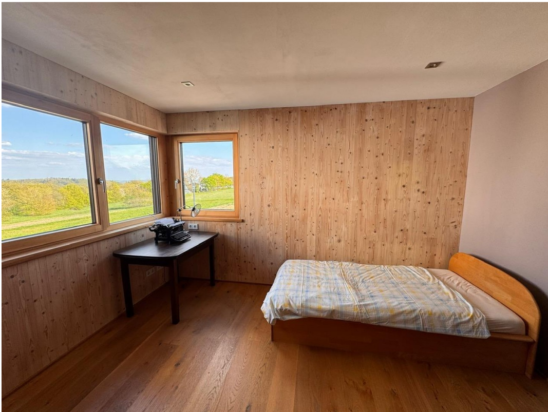
Kinderzimmer: Blick ins Grüne