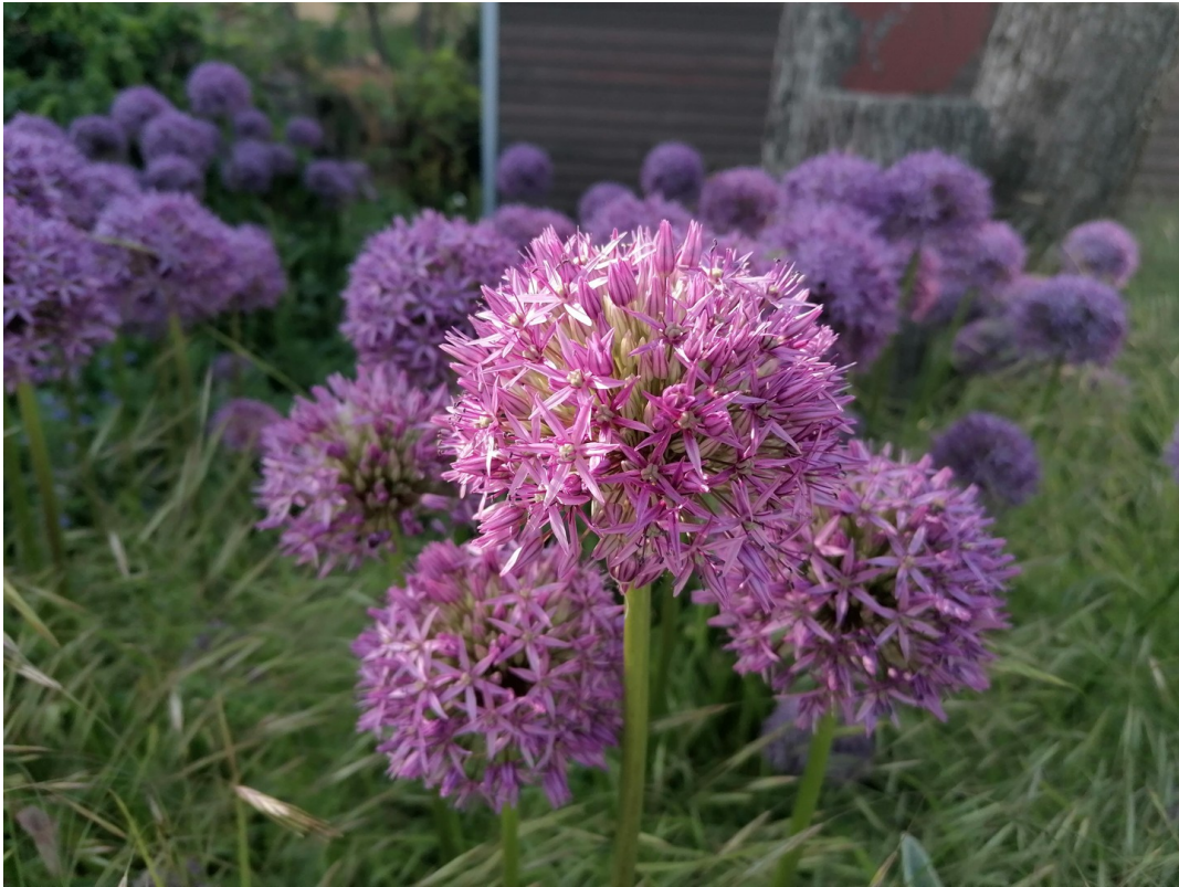
Blüten im Vorgarten