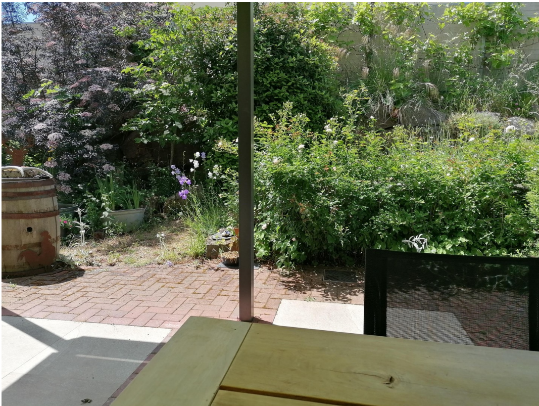
Terrasse und Garten