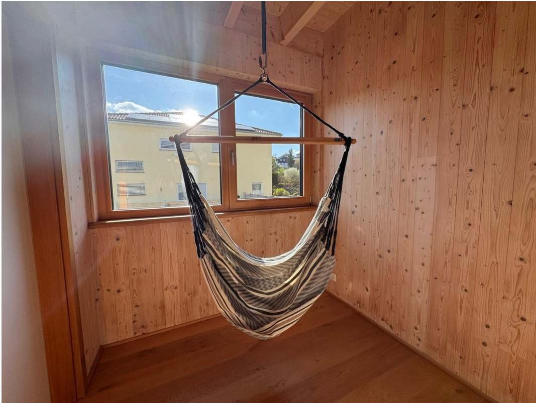
Flur im OG