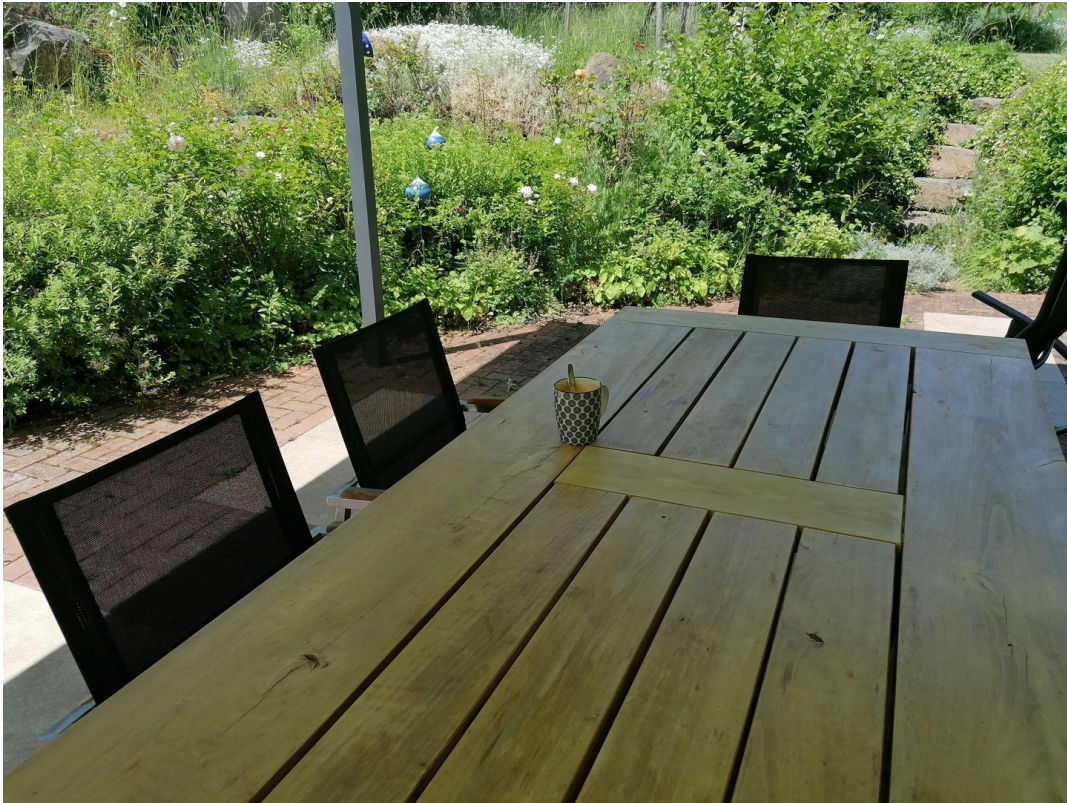
Terrasse und Garten