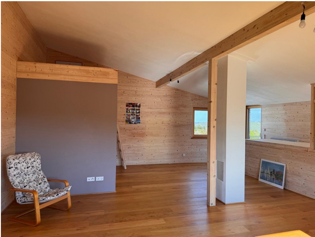
Studio im DG