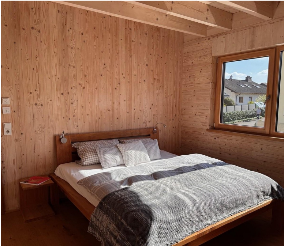
Schlafzimmer incl. Ankleide