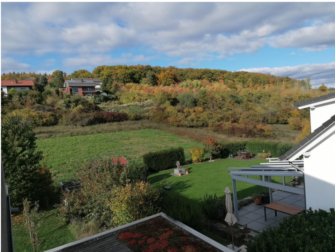
Blick Richtung Waldrand