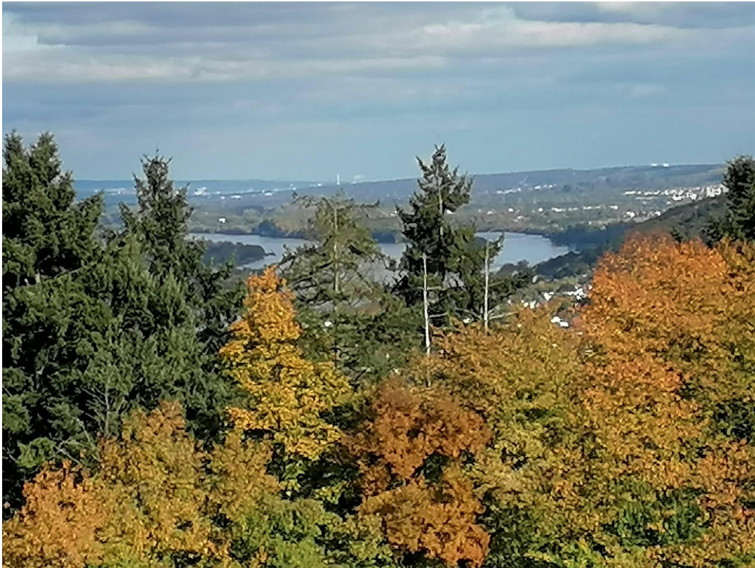
Blick von der Sonnenterrasse