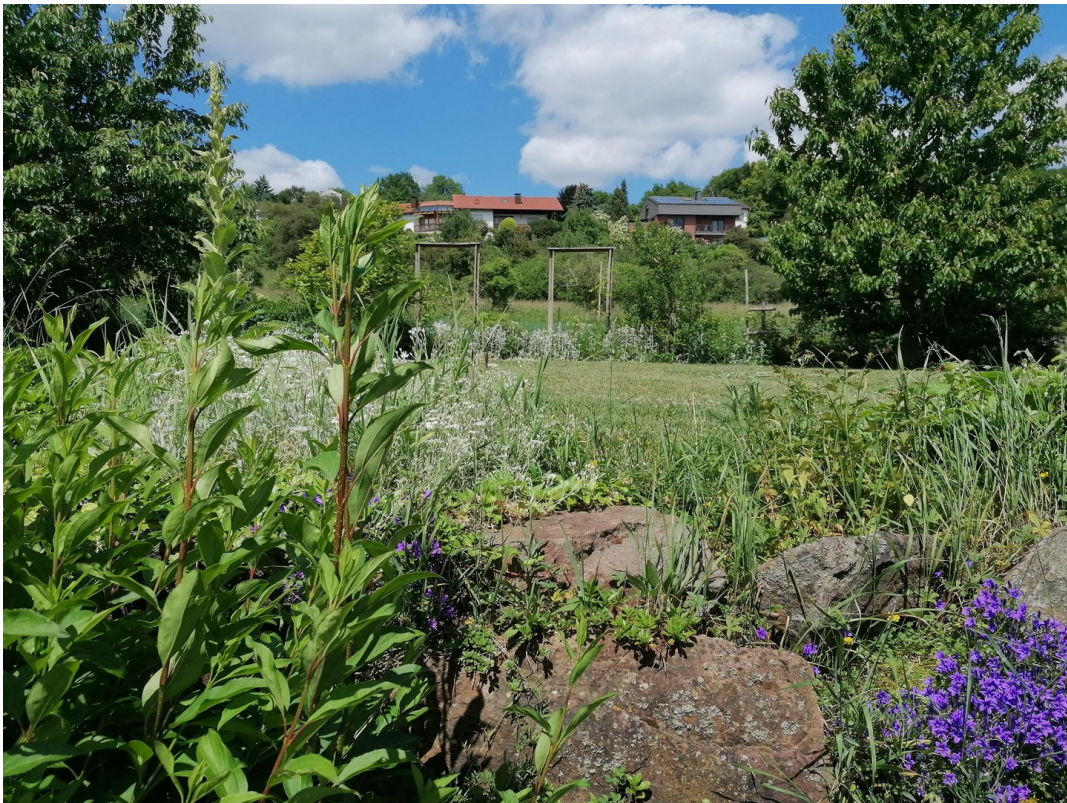
Viel Platz zum Spielen