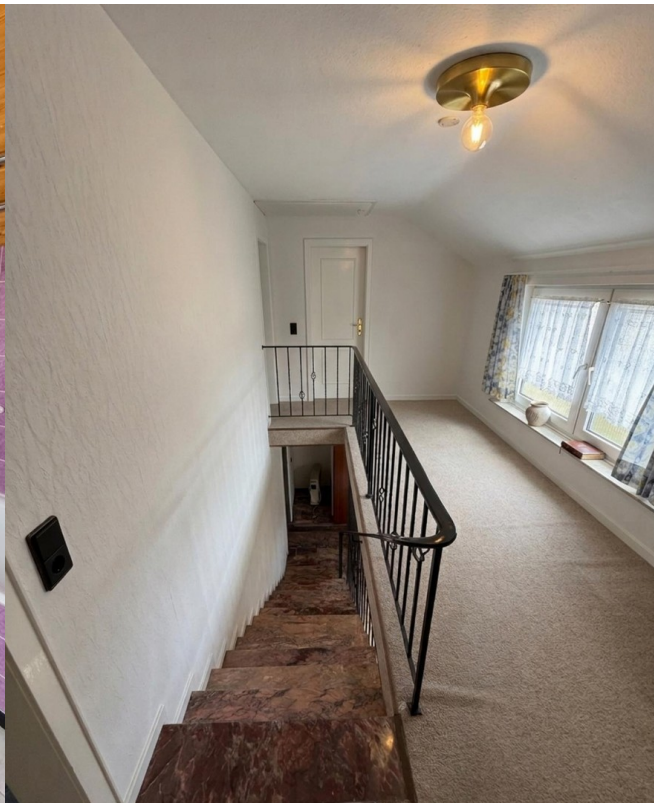
Flur 1. OG