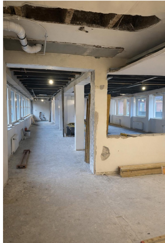
Der derzeitige Ausbaurzustand