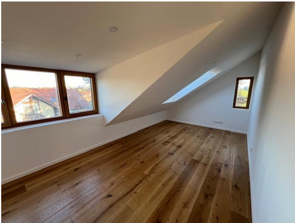
Zimmer 1 DG Süd/Osten