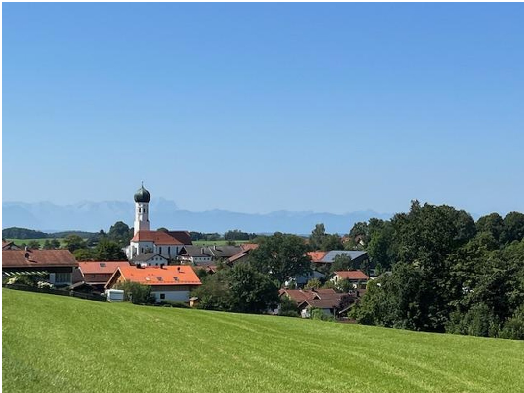
Blick auf Münsing