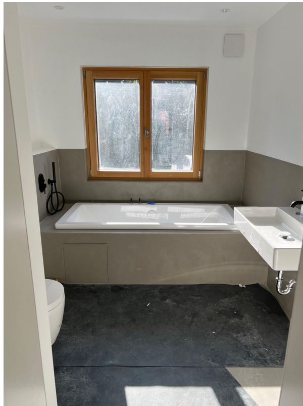
Bad OG mit Wanne