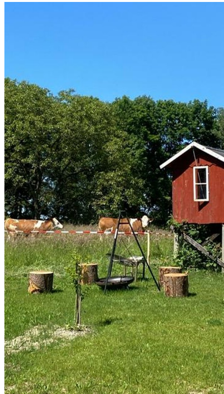
Garten Richtung Norden 3