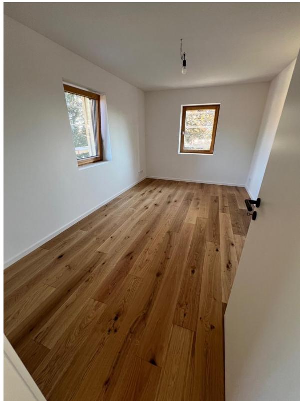
Zimmer 2 OG Süd/Osten