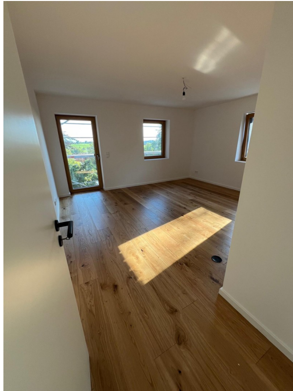
Zimmer 1 OG Süd/Westen