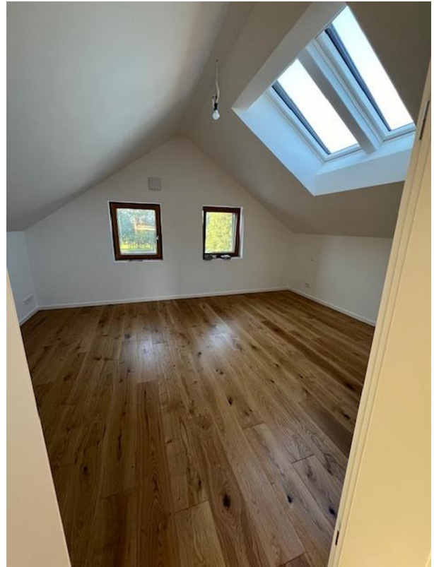
Zimmer 3 DG Norden