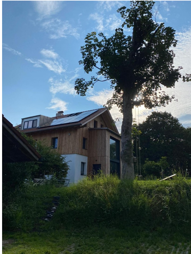
Norden mit Eingang