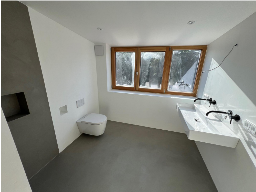
Bad DG mit Dusche