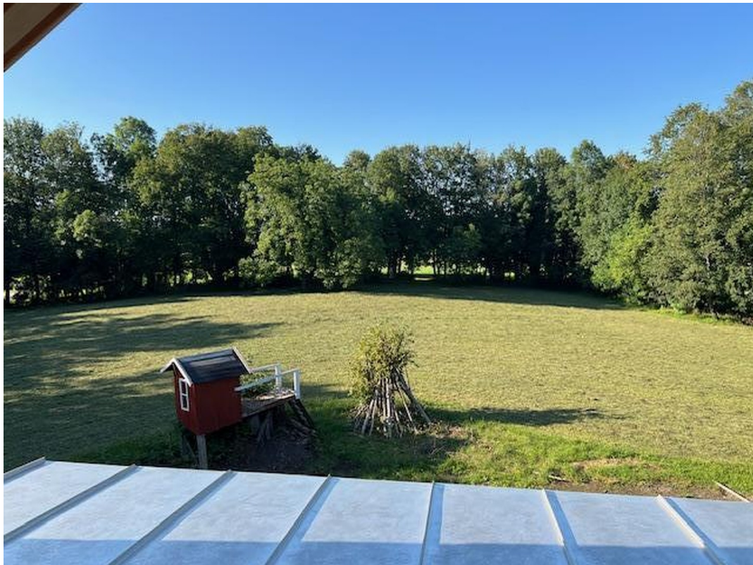
Blick aus DG nach Norden