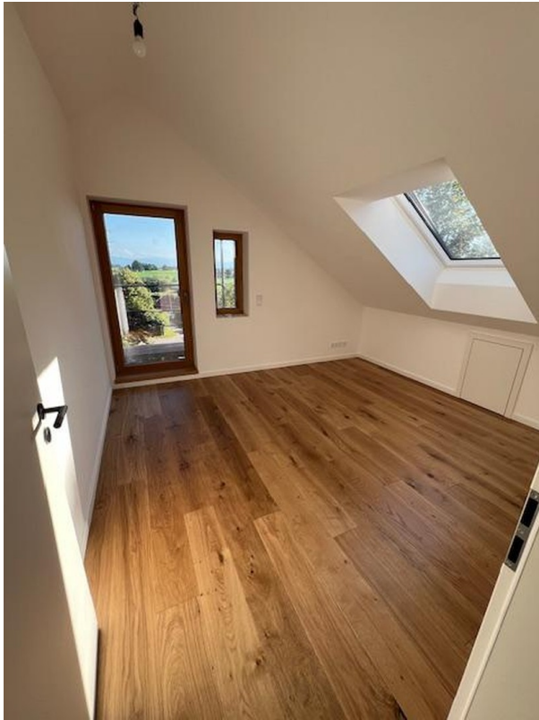
Zimmer 2 DG Süd/Westen