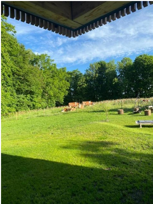
Garten Richtung Norden 2