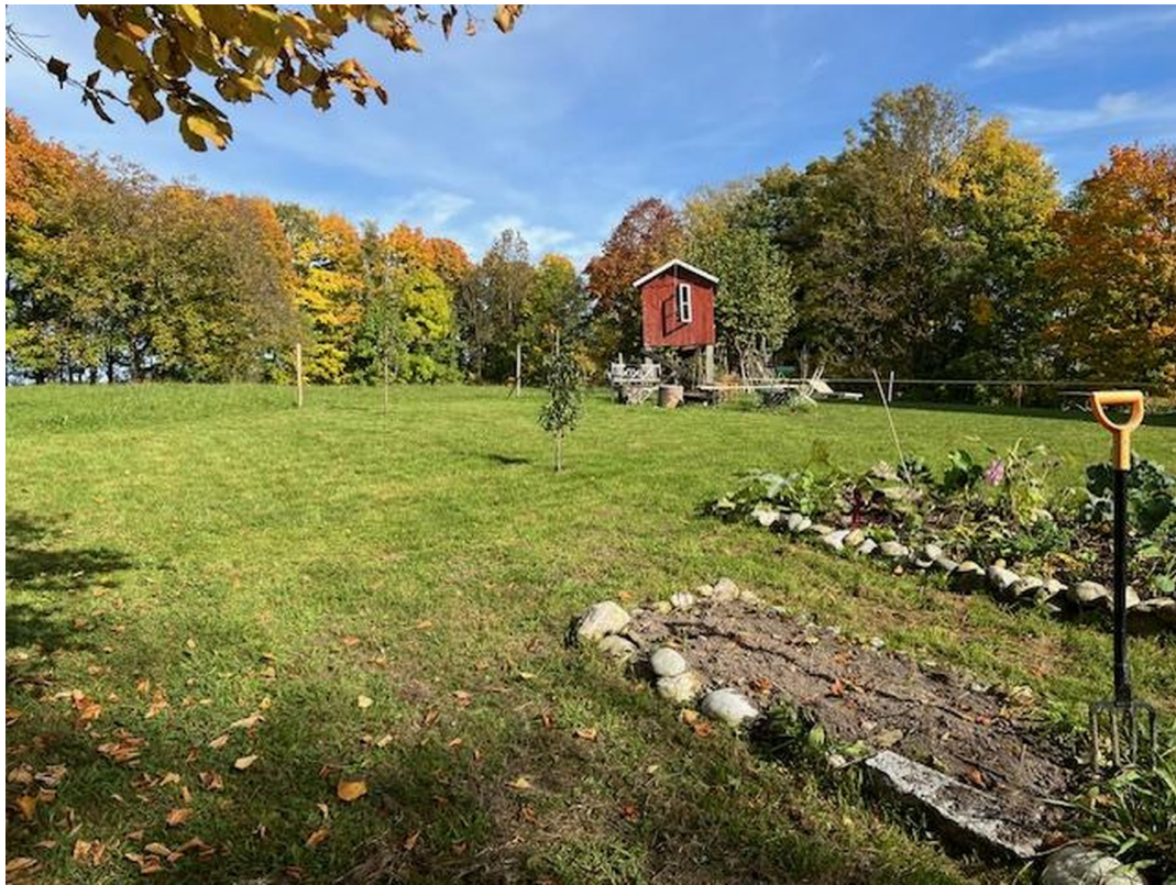
Garten Richtung Norden