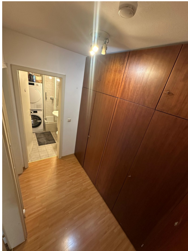
Flur mit Einbauschränk