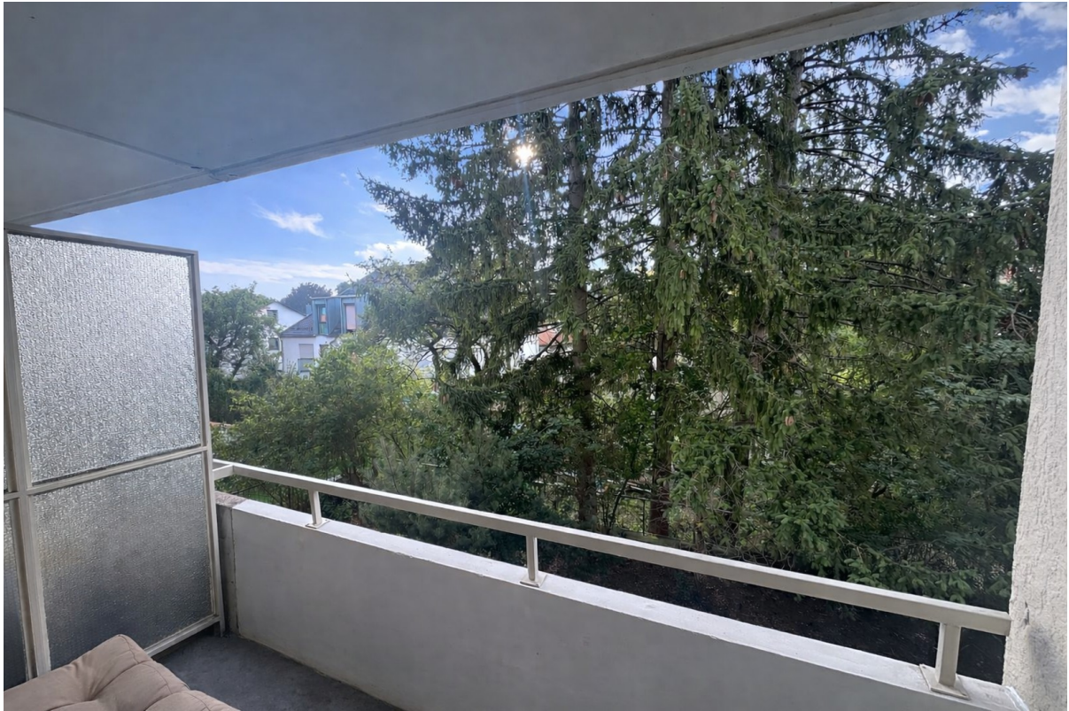
Balkon vor Renovierung