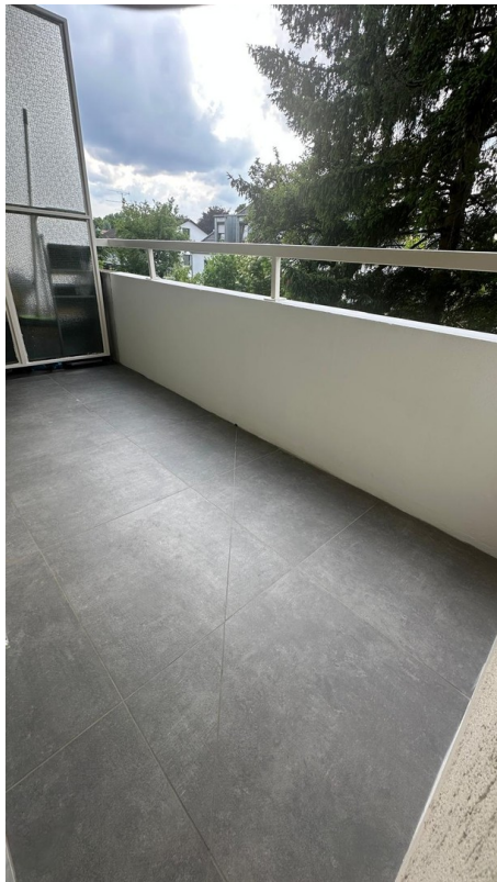
Balkon nach Renovierung