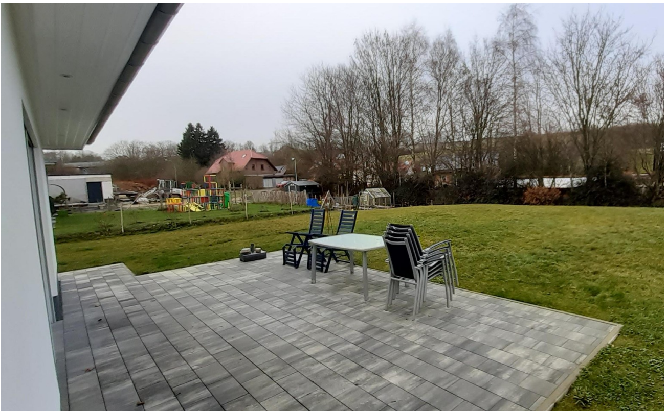
Terrasse und Garten