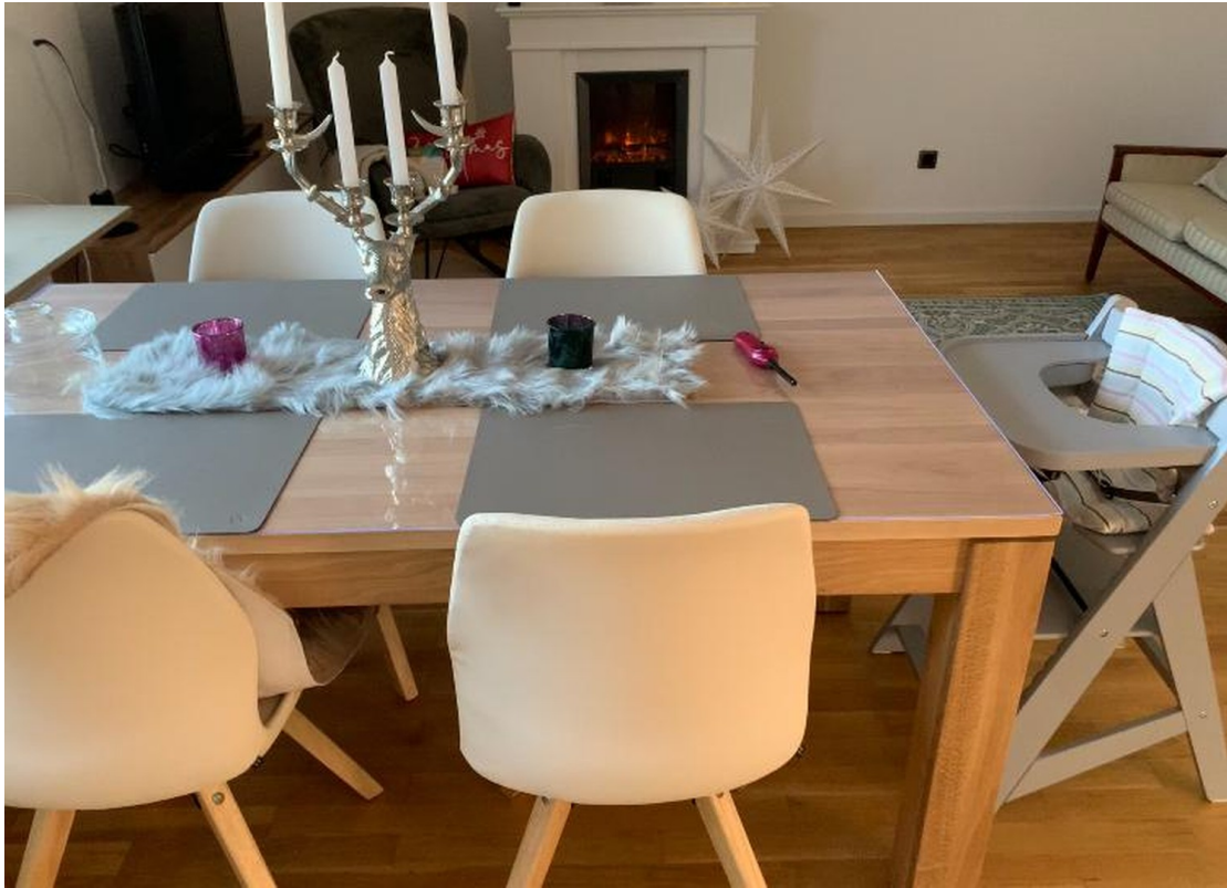
Esstisch quer gestellt