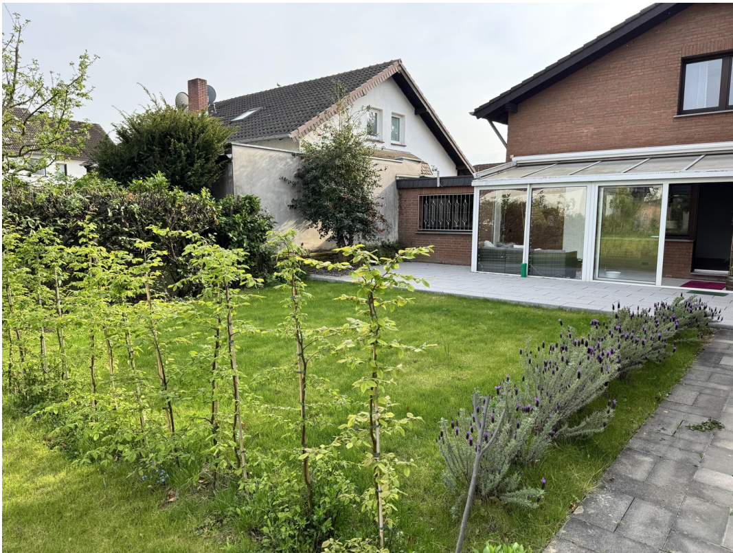
Garten und Terrasse