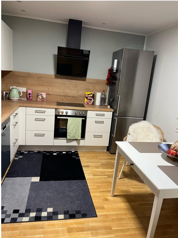
Ausschnitt 2 Küche