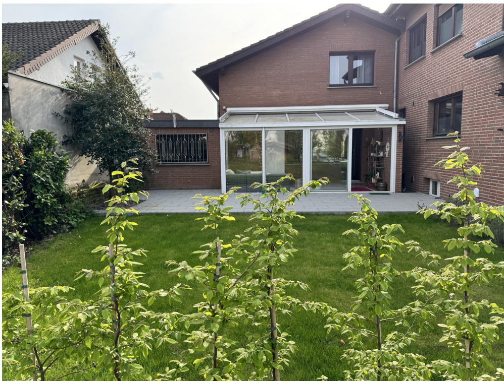
Garten und Terrasse