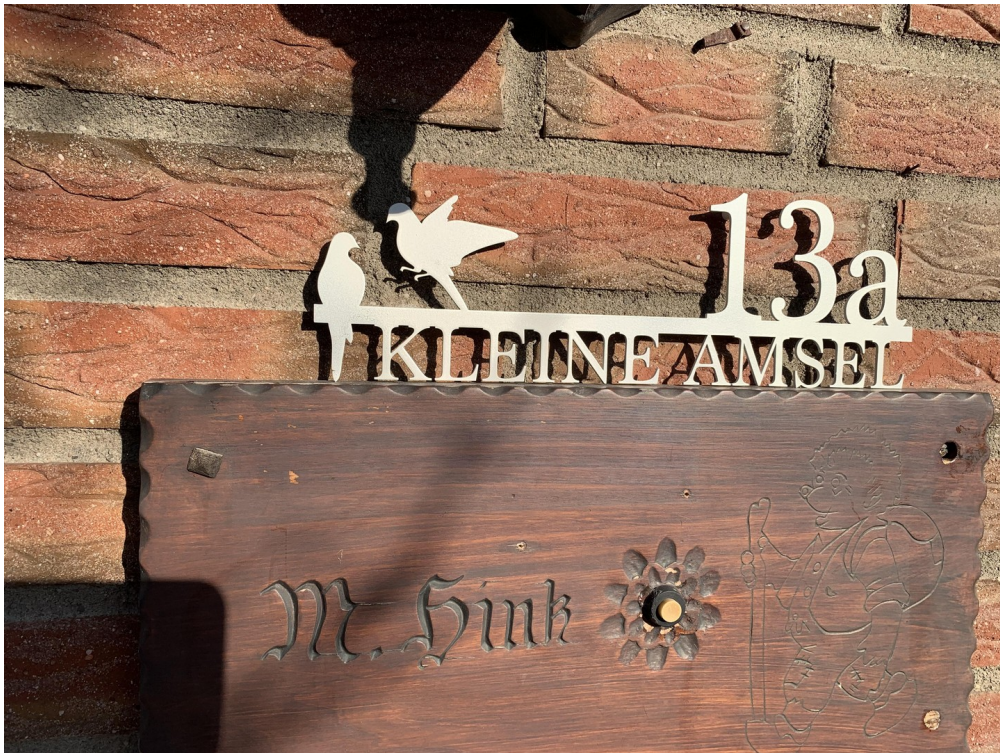
Unsere kleine Amsel