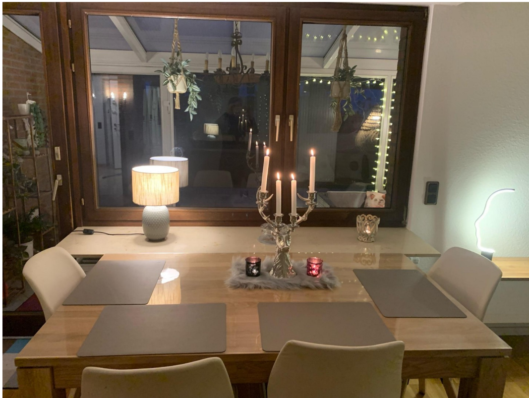
Esstisch längs gestellt