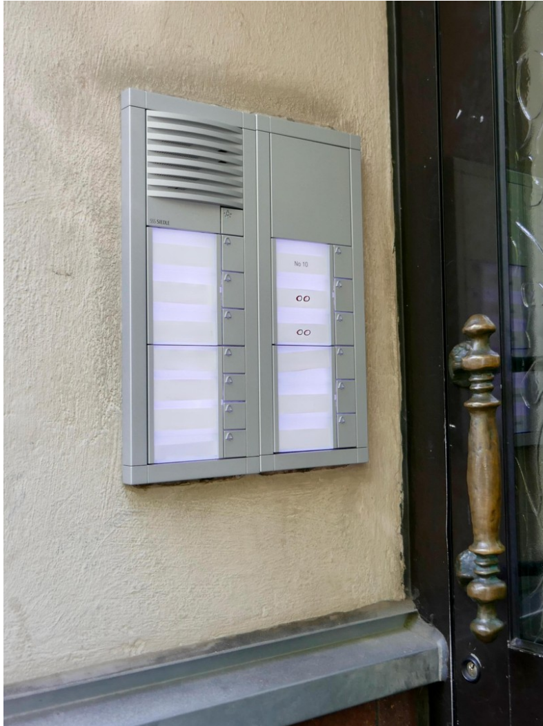
Neue Klingelanlage (2026)