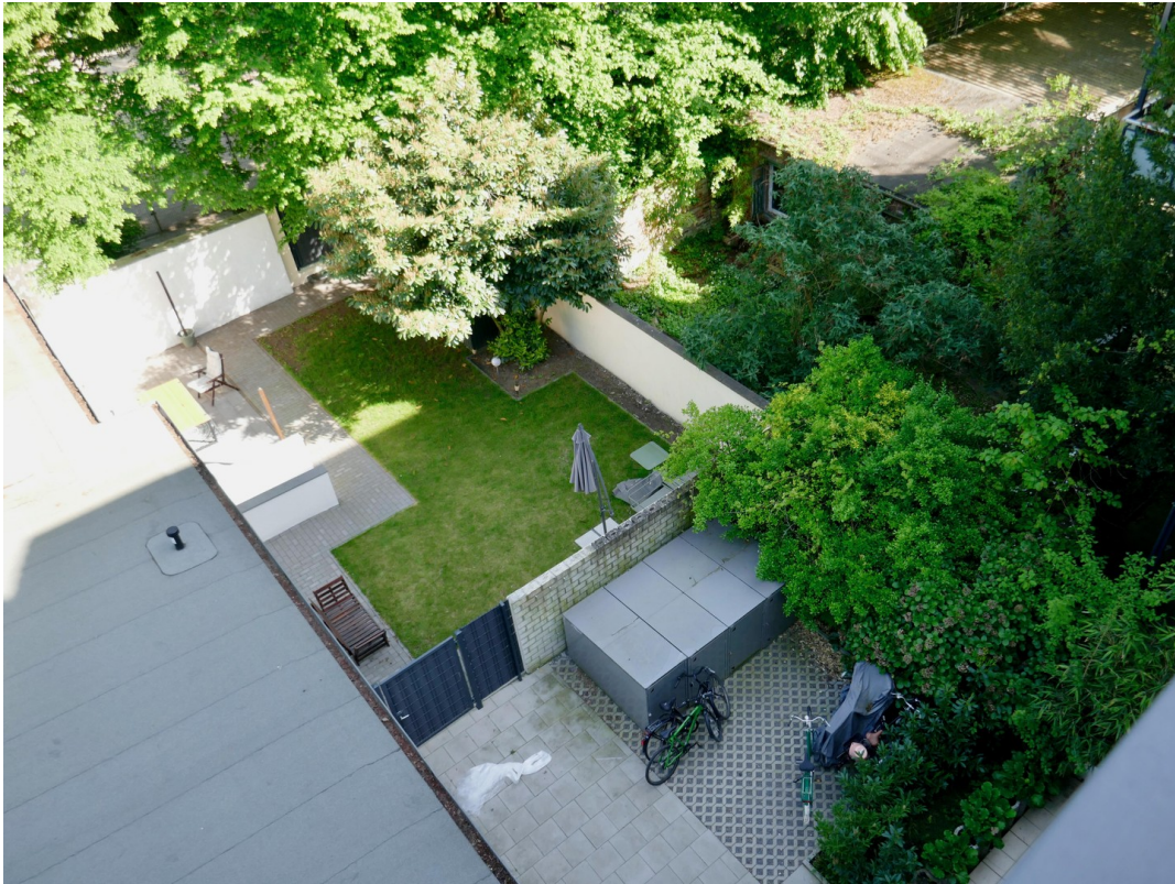
Blick von Balkon, Innenhof