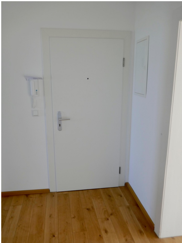
Flur/ Diele/ Garderobe