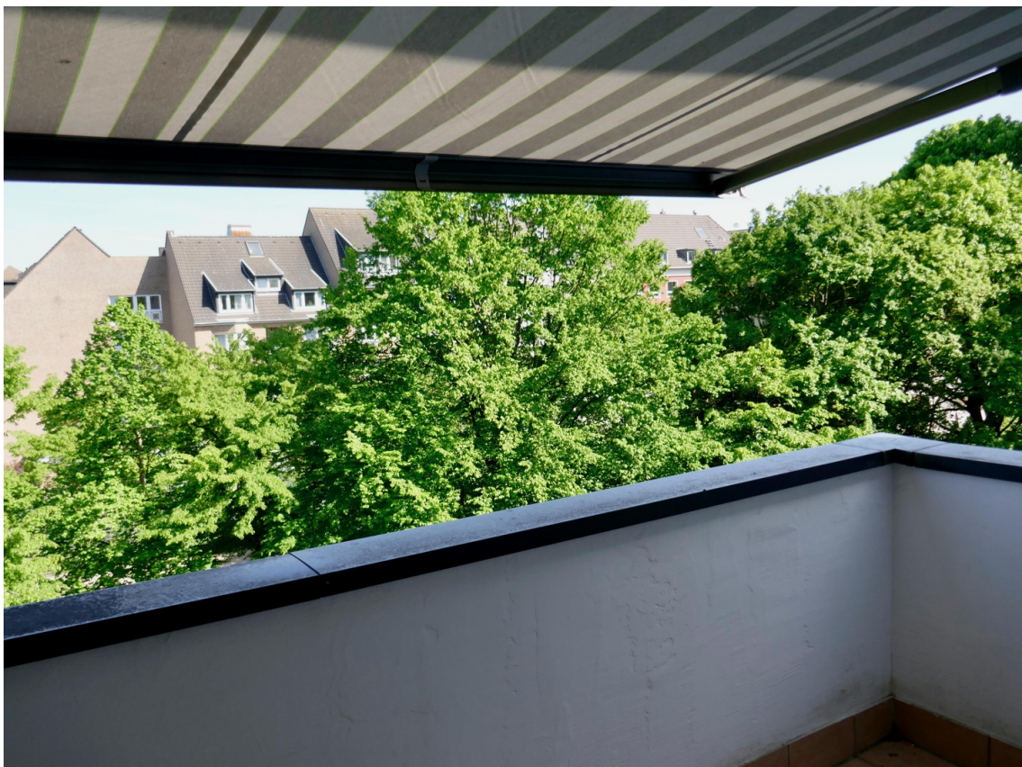
Balkon mit weinor Markise