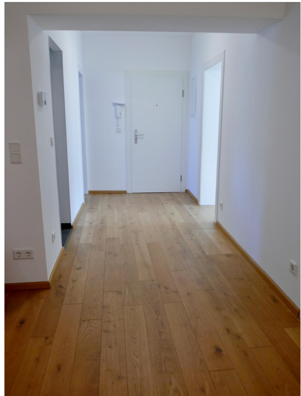
Flur/ Diele/ Garderobe