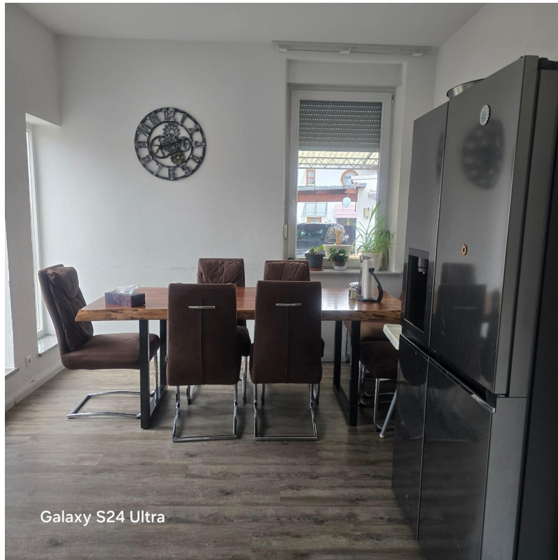
Galaxy S24 Ultra