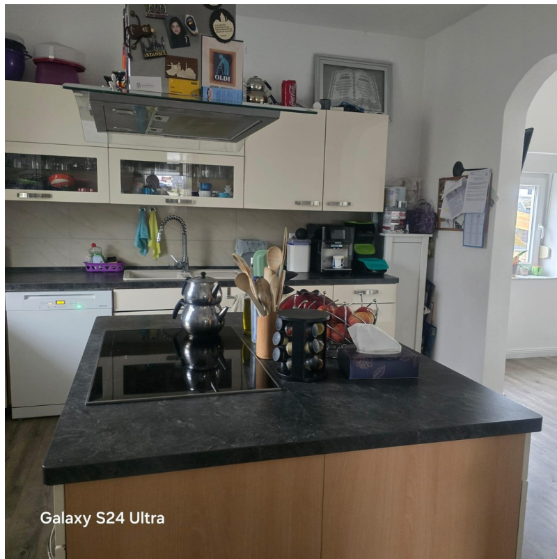
Galaxy S24 Ultra