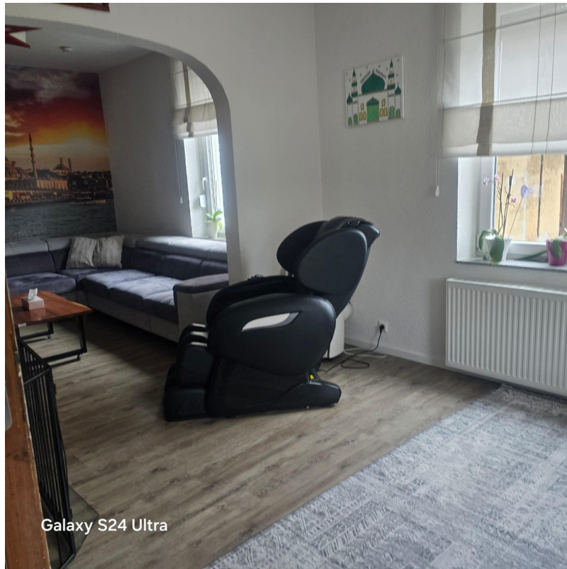
Galaxy S24 Ultra