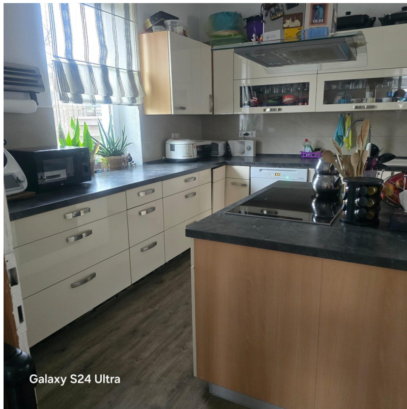
Galaxy S24 Ultra