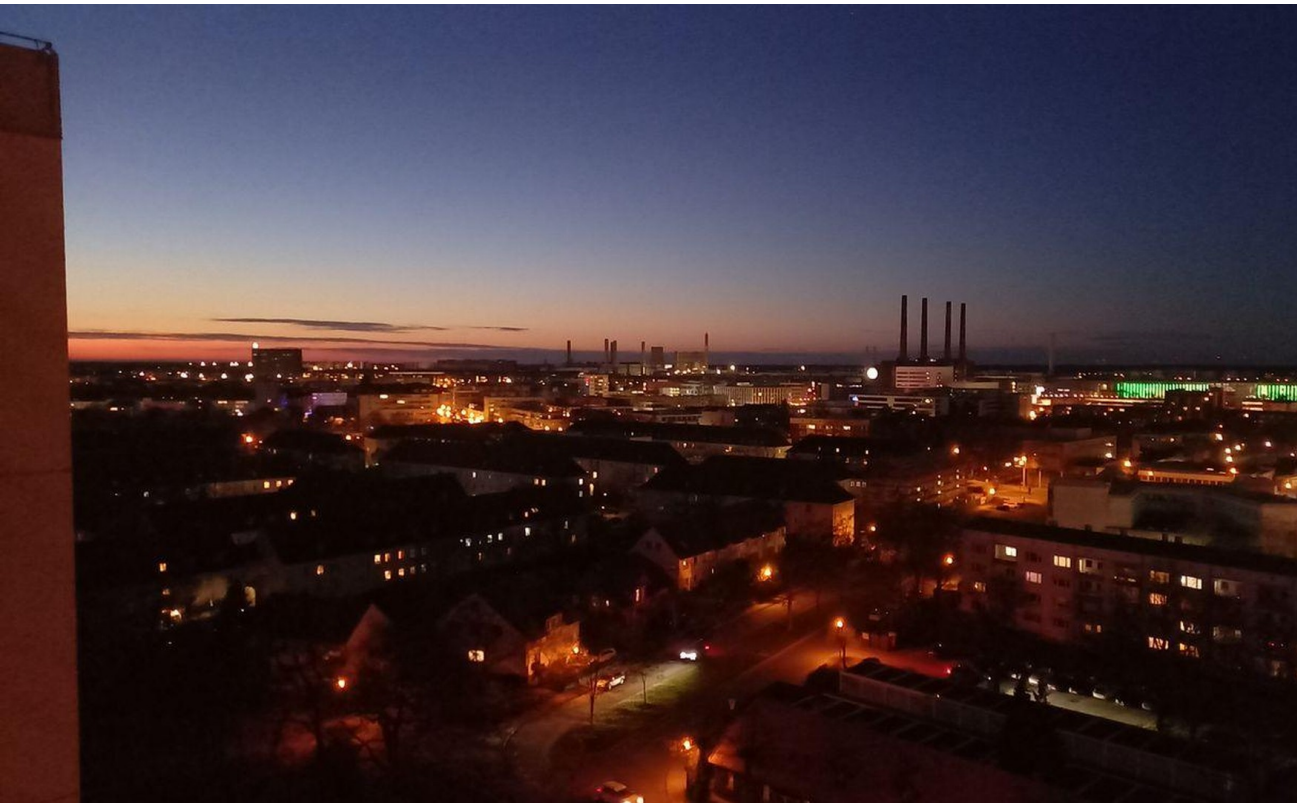
Ausblick Küche abends