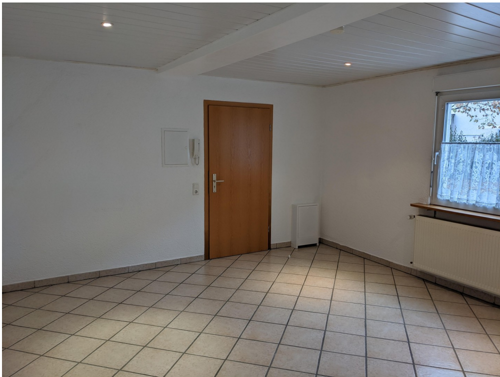
Eingangsbereich und Wohnzimmer