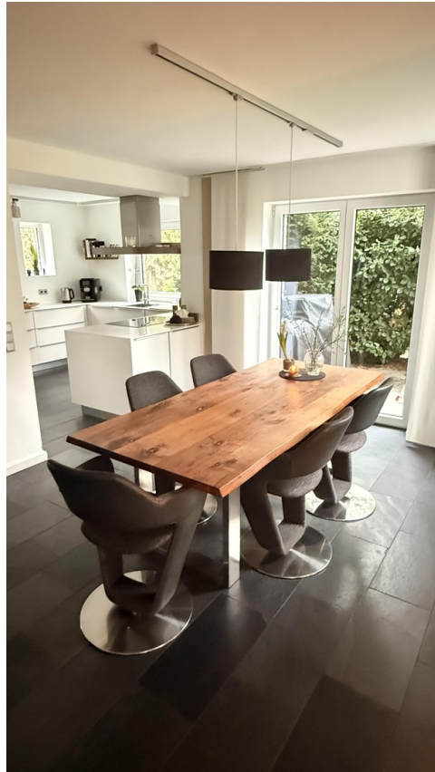
Essbereich mit Blick zur offen