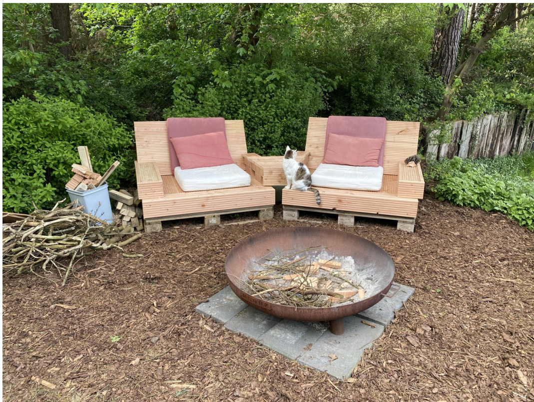
Lounge mit Feuerstelle