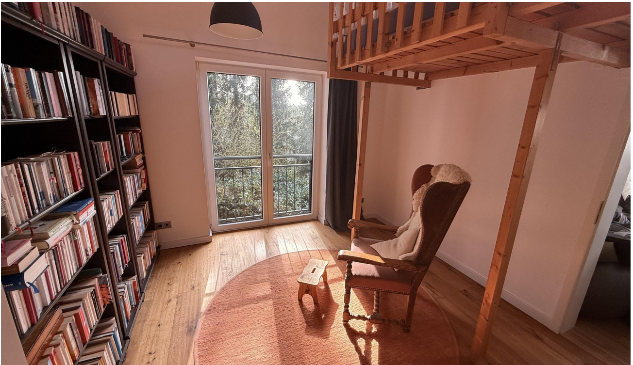
Kinderzimmer mit Hochbett