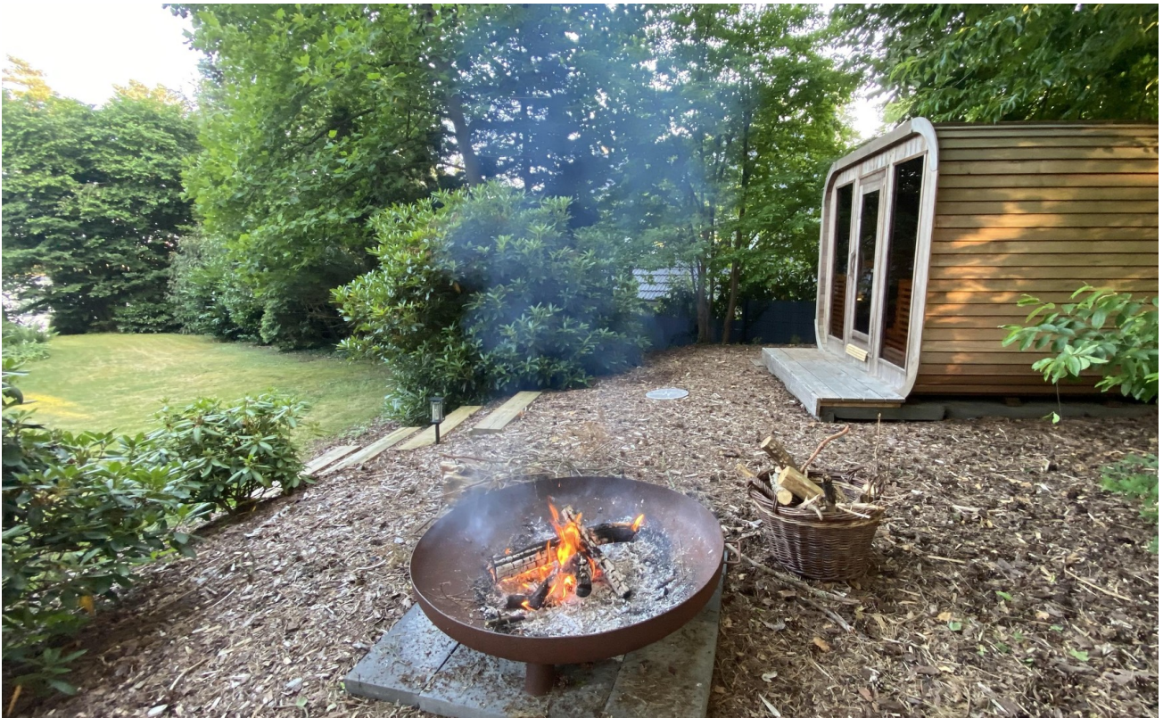
Gartensauna mit Lounge