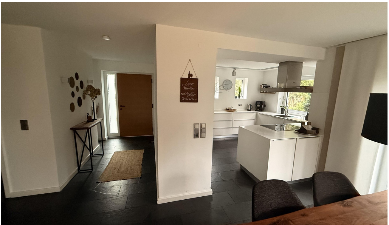
Flur zum Haupteingang & Küche