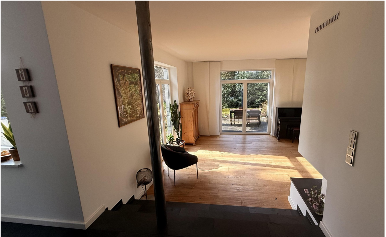
Blick in den Wohnbereich