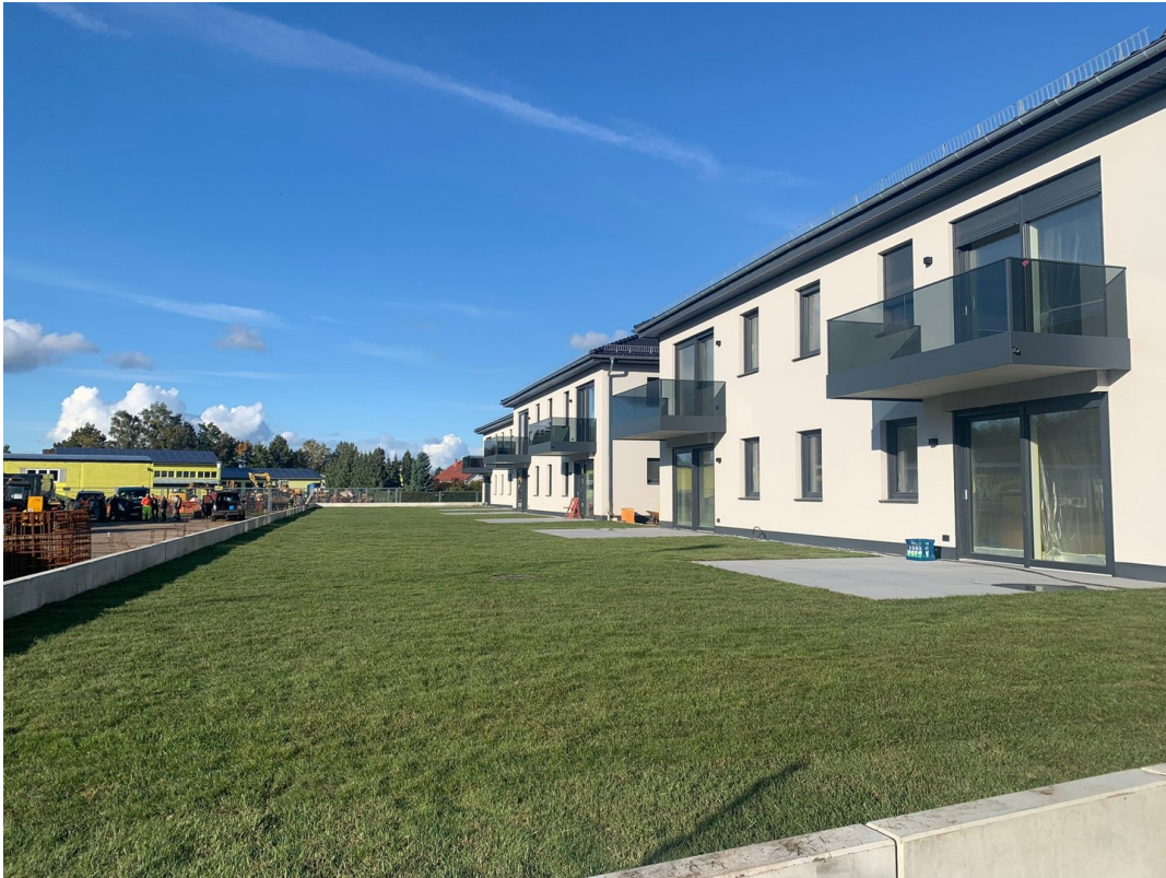
Rückseite der Liegenschaft