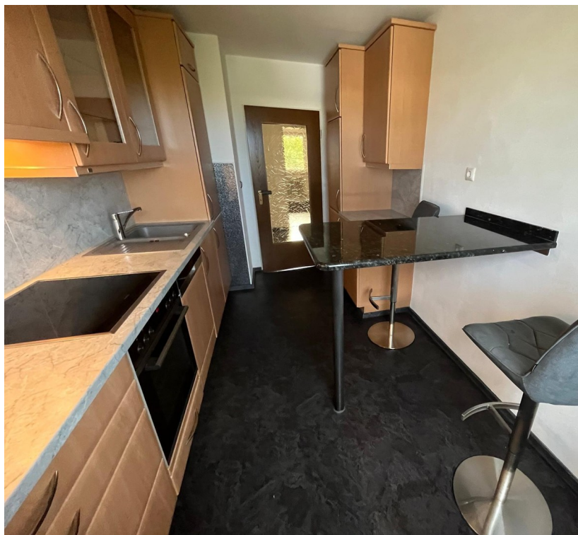
EBK mit Essplatz