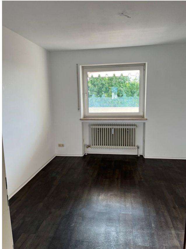
Zimmer für HO