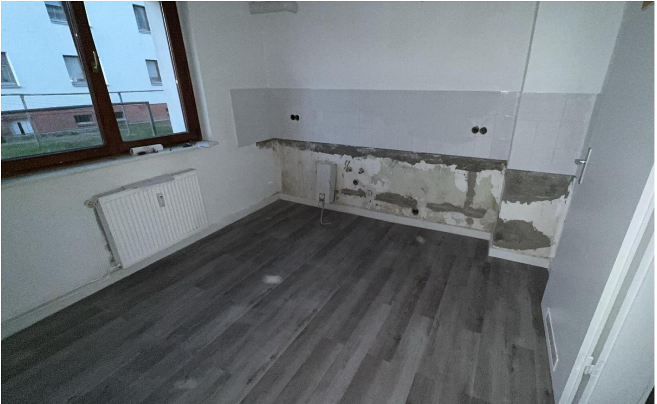
Küche (Wird noch gestrichen)