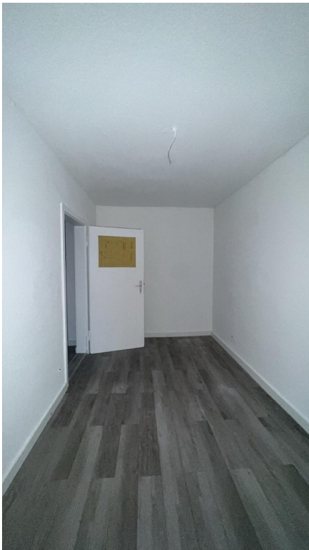
Büro / Kind 2