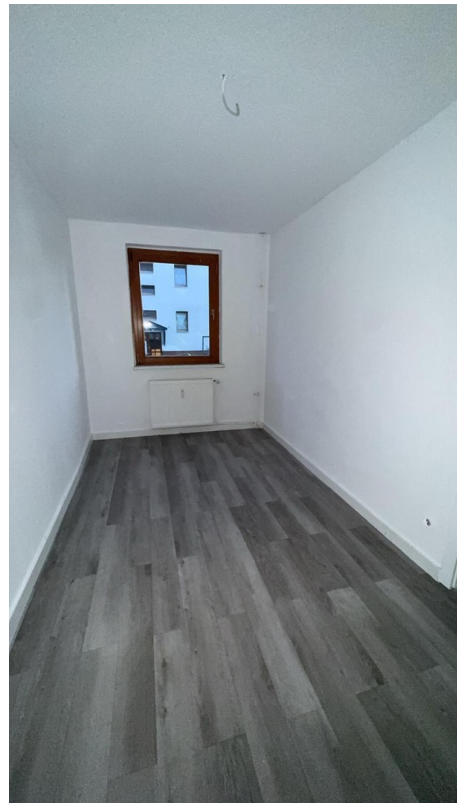
Büro / Kind 2