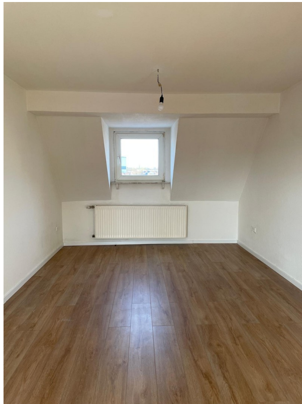
Zimmer 3 - wenn Wand