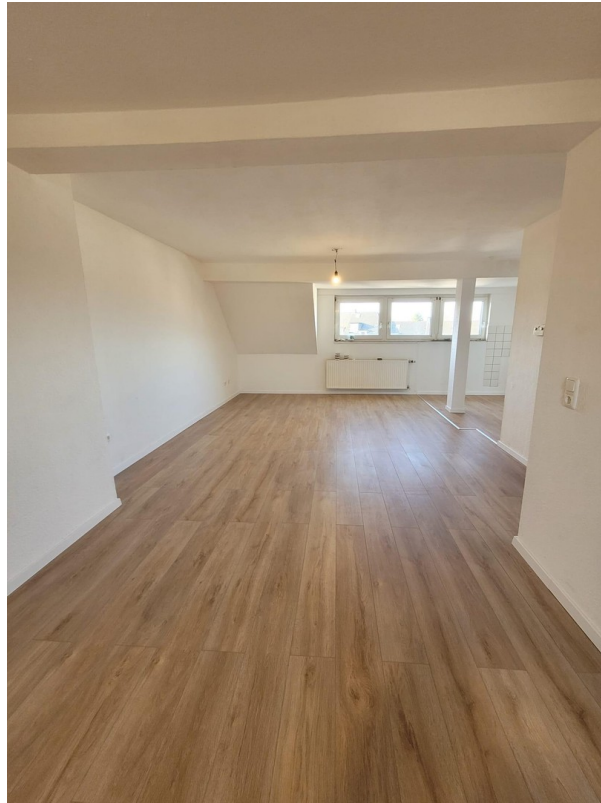
offener Wohn / Essbereich