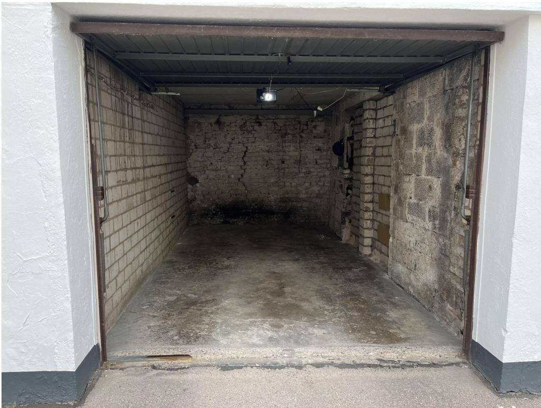
Garage - Beispiel