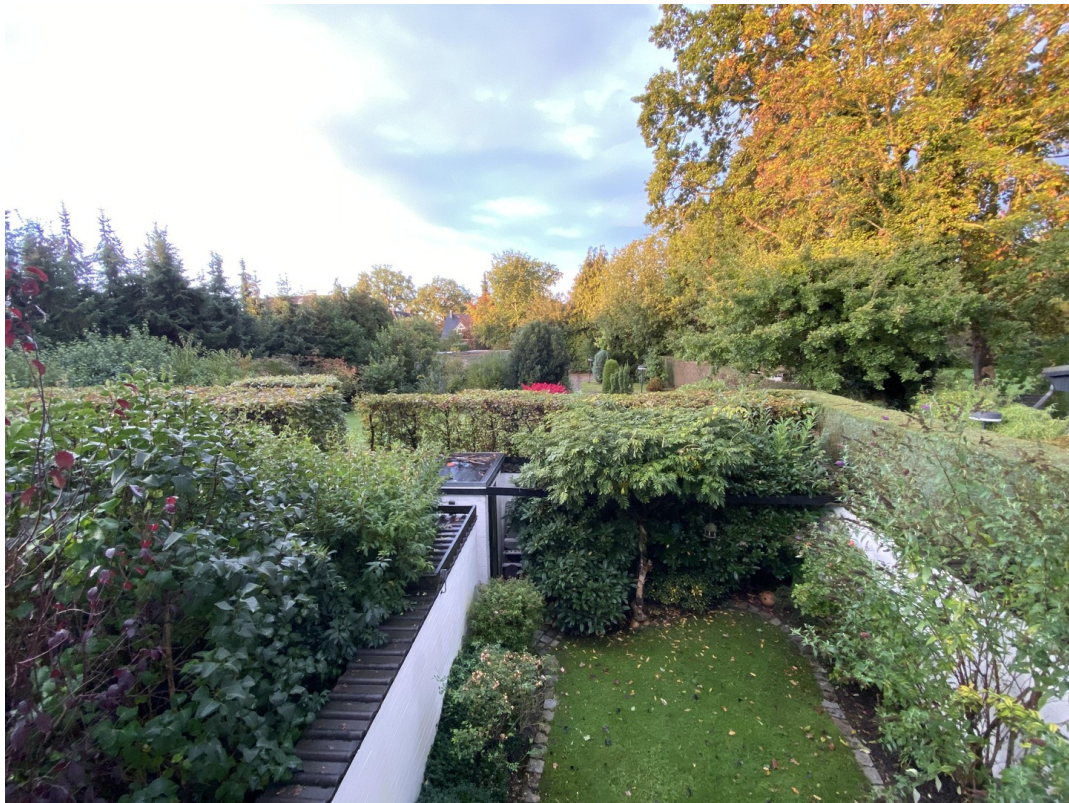
Blick aus dem Obergeschoss