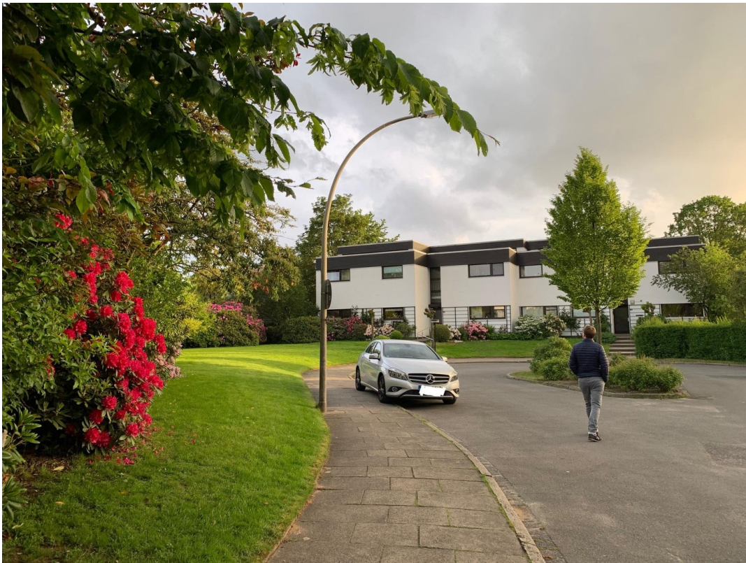
Lage der Wohnung in Sackgasse