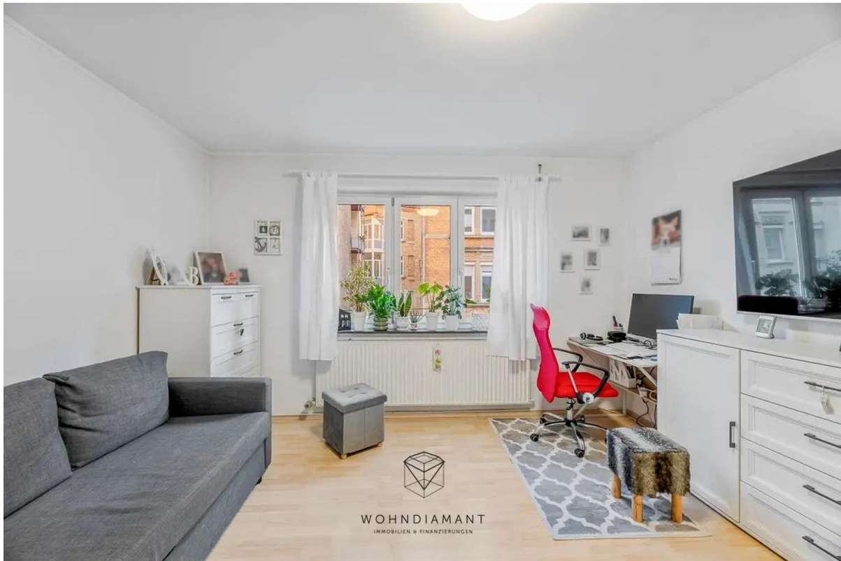
Arbeits- oder Kinderzimmer