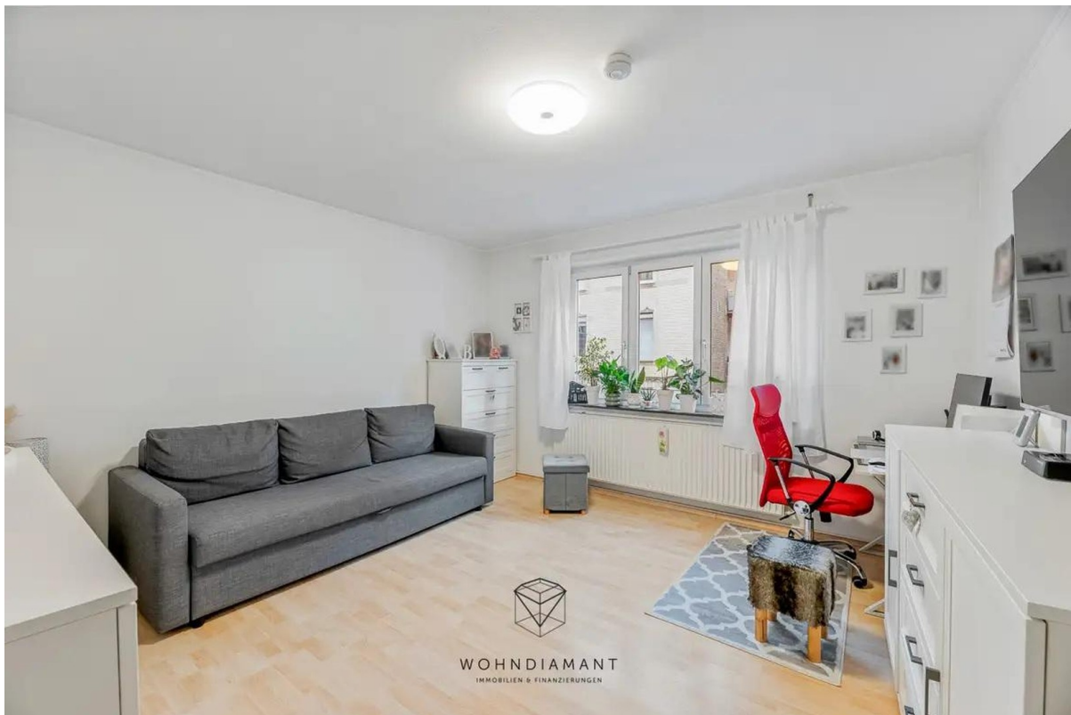
Arbeits- oder Kinderzimmer