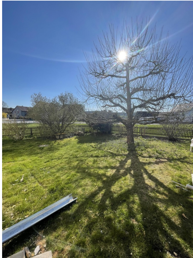
Garten mit Apfelbaum