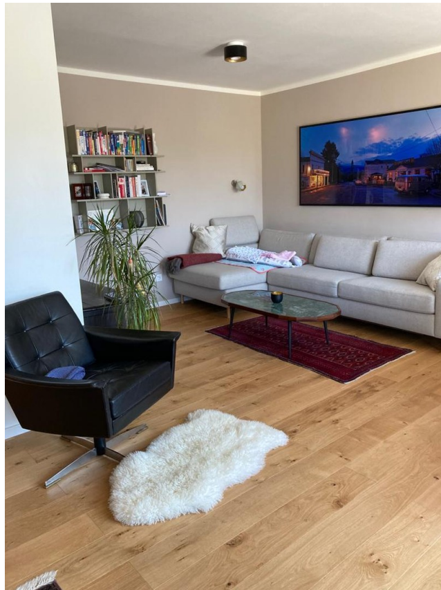
Wohn/Esszimmer Perspektive 2