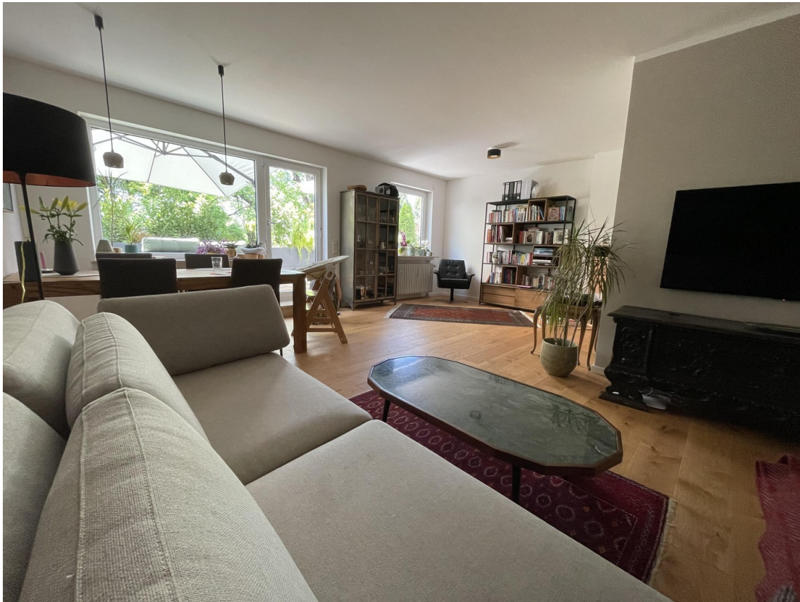
Wohn-/Esszimmer Perspektive 1