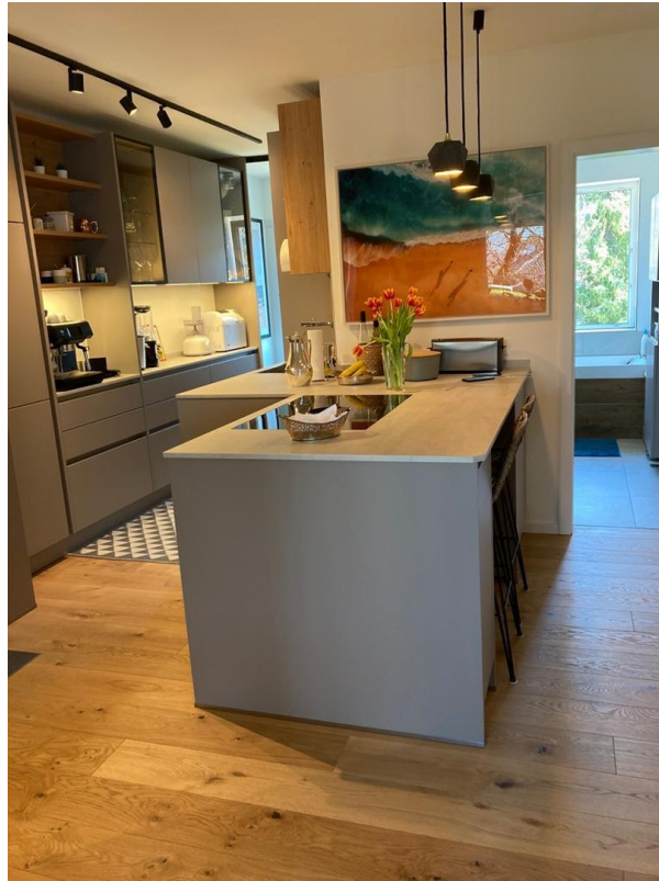
Moderne, hochwertige Küche