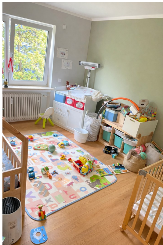
Eines der Schlafzimmer