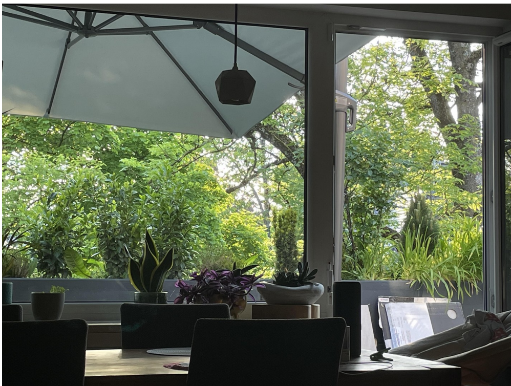
Blick vom Esstisch